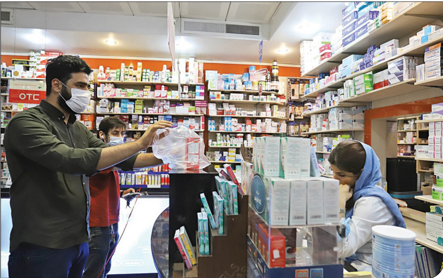
نگرانی بیماران پس از مکانیسم ماشه افزایش یافت