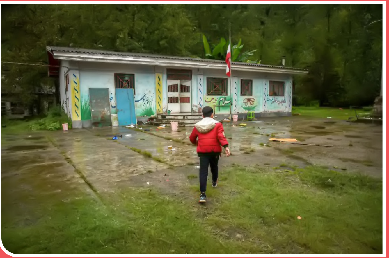
روستای «هلی بن» و «اسبو» از توابع بخش بندپی شرقی شهرستان بابل در استان مازندران است که در نزدیکی هم قرار دارد. در سال ۱۳۹۴ انتشار عکسی از مدرسه روستای اسبو در مطبوعات منجر به ساخت مدرسه جدید توسط خیرین در سال ۱۳۹۸ در همان روستا شد. مدارس روستاهای اطراف و در حاشیه استان مازندران نیاز به توجه بیشتر مسئولان دارند.