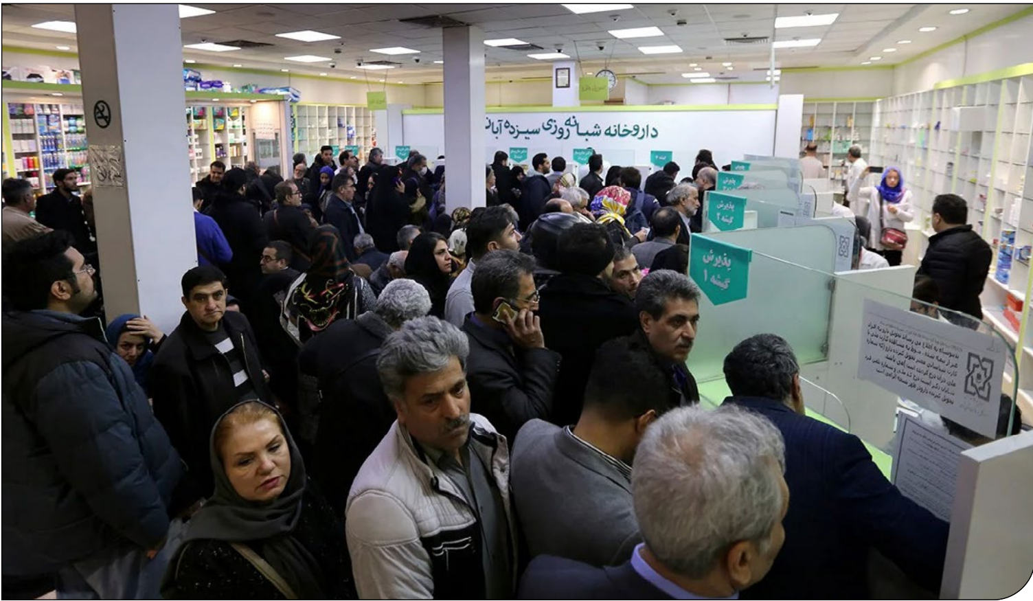
| Getty Images |

کمبود ۲۰۰ قلم دارو، بدهی ۱۰۰ همتی بیمه‌ها و هشدار درباره بحران آنتی‌بیوتیک‌ها