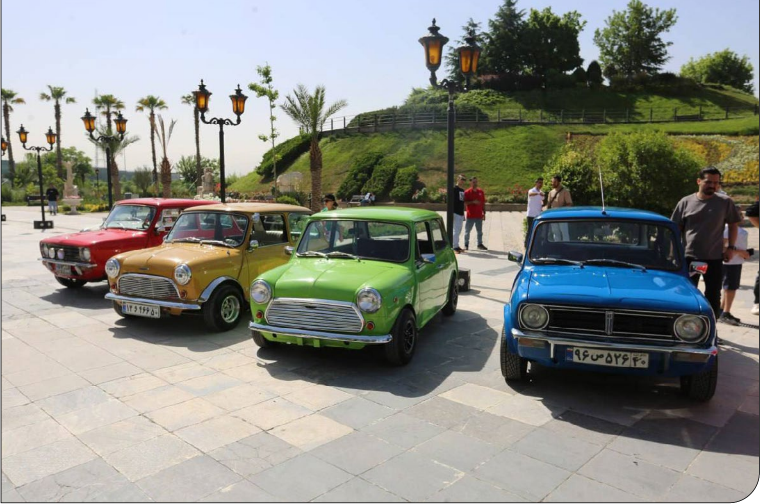
سبنا بزرگسوی فردا