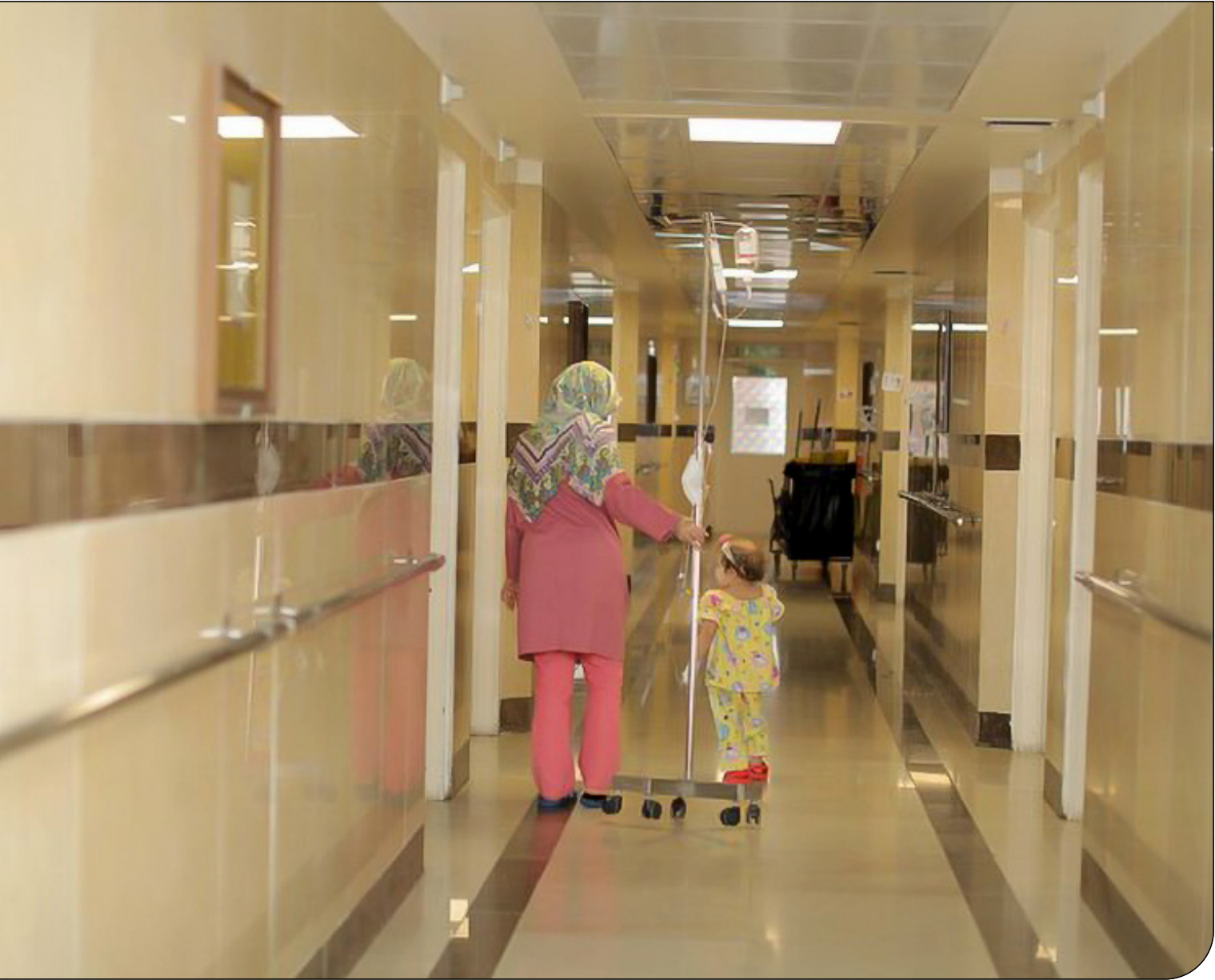
- ۳ - [عک]

هزینه‌های سرسام‌آور داروهای سرطان تنها با اتکا به کمک‌های مردمی قابل‌تأمین نیست