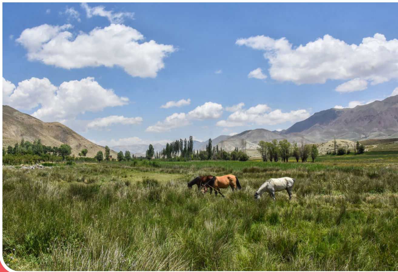
منطقه بیلاقی «دشت سفید» روستای جاشم لوبار از توابع بخش شه میرزاد در فاصله ۳۶ کیلومتری شمال شهرستان مهدیشهر و ۵۳ کیلومتری مرکز استان سمنان واقع شده است. در این منطقه بیلاقی و کوهستانی، مناظر زیبا، مزارع، باغ‌ها، چشمه‌ها و مراتع و دشت‌های وسیع سرسبز خودنمایی می‌کند.