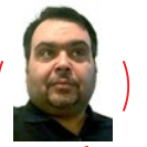
علیرضا فدایی‌کرماتی | منتقد سینما