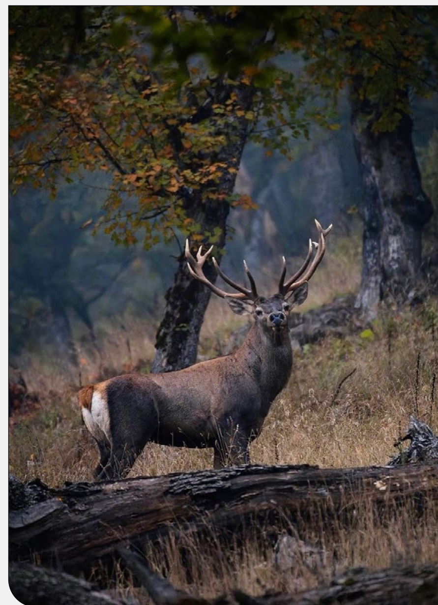
مزالها در فصل جفت‌گیری در جدال با خطر شکارچیان غیرمجاز و تورهای گردشگری