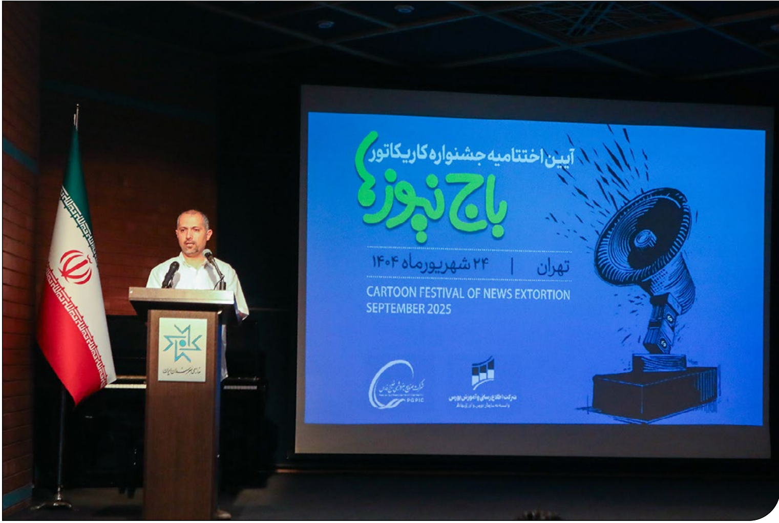
اختتامیه اولین جشنواره کاریکاتور «باج‌نیوزها» برگزار شد