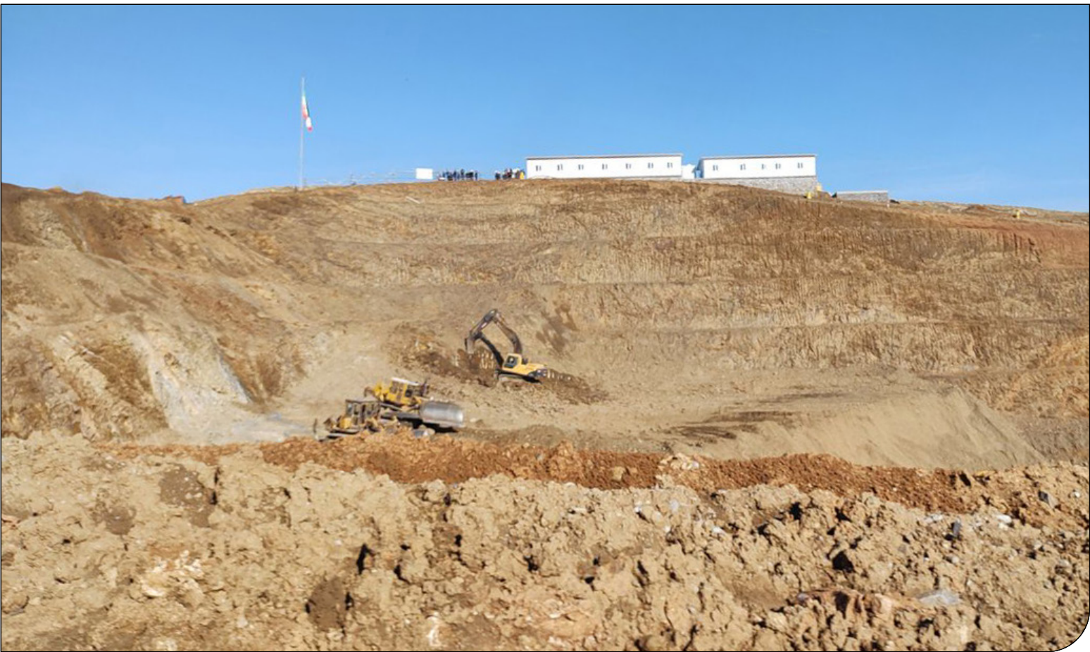
شلیک به معترضان معدن طلای سقز یک کشته و سه زخمی بر جای گذاشت

انصاری تأکید کرد: «پیشگیری از جرایم محیط‌زیستی به‌عنوان یک موضوع مهم باید مورد توجه قرار گیرد و در این زمینه هم سازمان محیط‌زیست به‌تنهایی نمی‌تواند کاری انجام دهد و انجام این مهم هم مختص به یک دستگاه نیست. در این زمینه قوه قضائیه دارای وظایفی ذاتی و قانونی است و انتظار داریم از ظرفیت‌های قضائی در حرکتی هم‌سو و هماهنگ و متناسب با سیاست‌های زیست‌محیطی، در این حوزه استفاده شود.» ایرنا