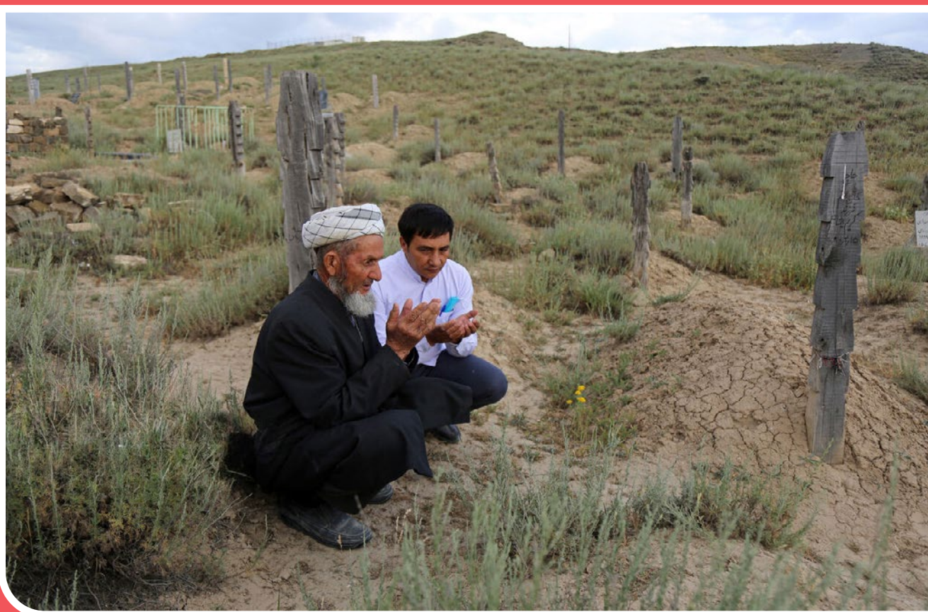
در شهرستان روستای «باغلق» در شهرستان راز و جرگلان خراسان شمالی به‌جای سنگ قبر، چوب‌های ساده با نوشته‌هایی از نام و مشخصات متوفیان بر مزارها نصب می‌شود. چوب‌هایی که بر باور بسیاری از اهالی این منطقه ابتدا در قالب نهال برای میثت از عذاب قبر کاشته می‌شده، ولی با گذشت زمان و غلبه باورهای قومی و ذوق شخصی در قالب چوب‌های خشک با دنده‌های متعددی بر سر مزار با مشخصات متوفی قرار گرفته است.