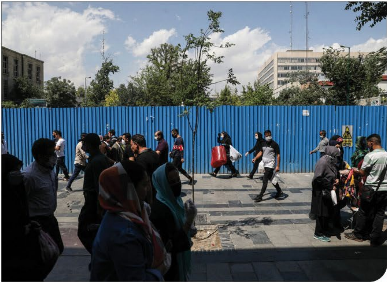
معاون رئیس‌جمهور در جریان بازدید از مدرسه دانش‌سرا

کتابخانه‌های «قلعه قابان» ماگو اگرچه زیر سایبان سنگی نیمه‌تولی در حال حوشن است، این قلعه یکی از قلعه‌های تاریخی منطقه آزاد ماگو است که به‌دلیل صیقل‌گیری بدون کمر آسپب دیده است. این قلعه زمانی بخشی از شهر بوده است اما با افزایش جمعیت و کمبود فضاهای مسکونی و کاهش ایمنی ناشی از ریزش کلاشک مخروبه، به‌تدریج از سکنه خالی شده ولی هنوز هم قسمت‌هایی از ارگ و خانه‌های واقع در پیرامون آن باقی مانده است. براساس کوشش‌های باستان‌شناسی و خوشحالی کتابخانه‌های موجود در مجموعه تاریخی قلعه ماگو می‌توان این اثر را متعلق به سده‌های میانی دوره اسلامی براساس شواهد نسبت داد. ترجمه کتابخانه‌های موجود در این قلعه به‌جز مربوط به دوران صفوی مورد توجه قرار نگرفته است؛ به‌ویژه کتابخانه‌های لرمنی که برهم اهمیت زیاد در شناخت این حوزه فرهنگی، قرابت نشده بود. این کتابخانه‌ها که یکی از آنها بیشتر در دسترس گردشگران، افراد محلی و غیره قرار دارد، هم‌اکنون در حال احداث است. این قلعه هرچند قدمت چندصدساله دارد و یکی از آثار ارزشمند تاریخی منطقه است، اما متأسفانه بعد از گذشت چندین سال و بی‌توجهی مسئولین مربوطه تا سال ۹۵ به ثبت ملی نرسیده بود. اما با ثبت این قلعه پروژه‌های مرمتی و حفاظتی انجام شد و قسمت‌هایی از ارگ و خانه‌های این محدوده هنوز پارچ‌جاست و قلعه دارد؛ از جمله حمام، آب‌انبار، مسجد، کلیسا و خانه‌های قدیمی. اولین کوشش باستان‌شناسی در سال ۹۵ انجام شد، ولی نتایج آن منتشر نشد. باوجود این، مشخص شد این قلعه دارای چهار کتابخانه به زبان لرمنی و یک کتابخانه به زبان فارسی است. امهر