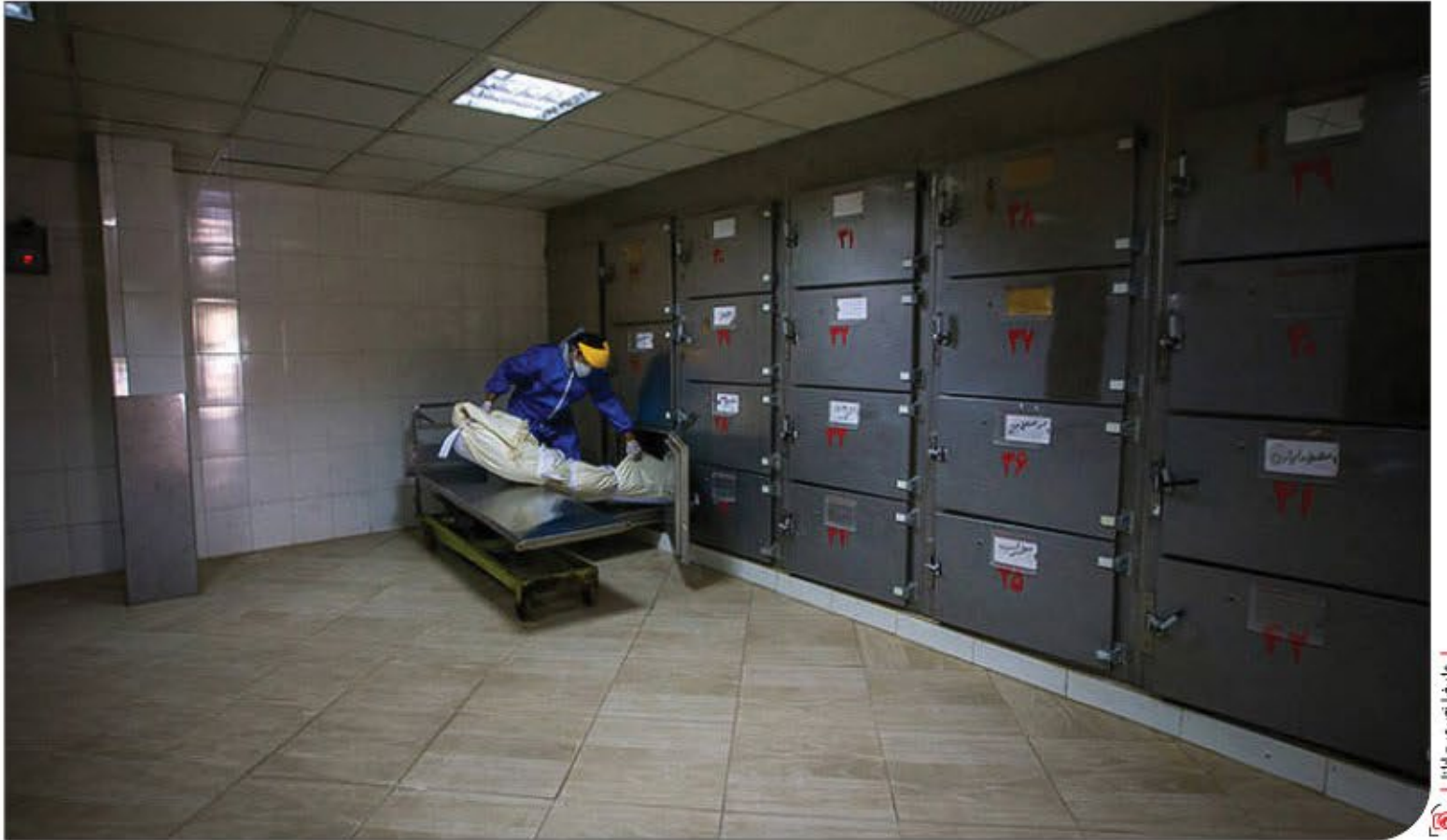
علیرضا صری - ایپانا