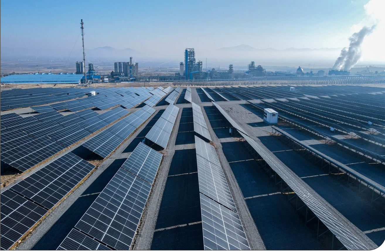
- مانیانرژی -

کارشناسان انرژی می‌گویند دولت باید به‌جای اجبار صنایع به ساخت نیروگاه از مسیر «تأسیس شرکت‌های سهامی عام در حوزه برق» وارد شود