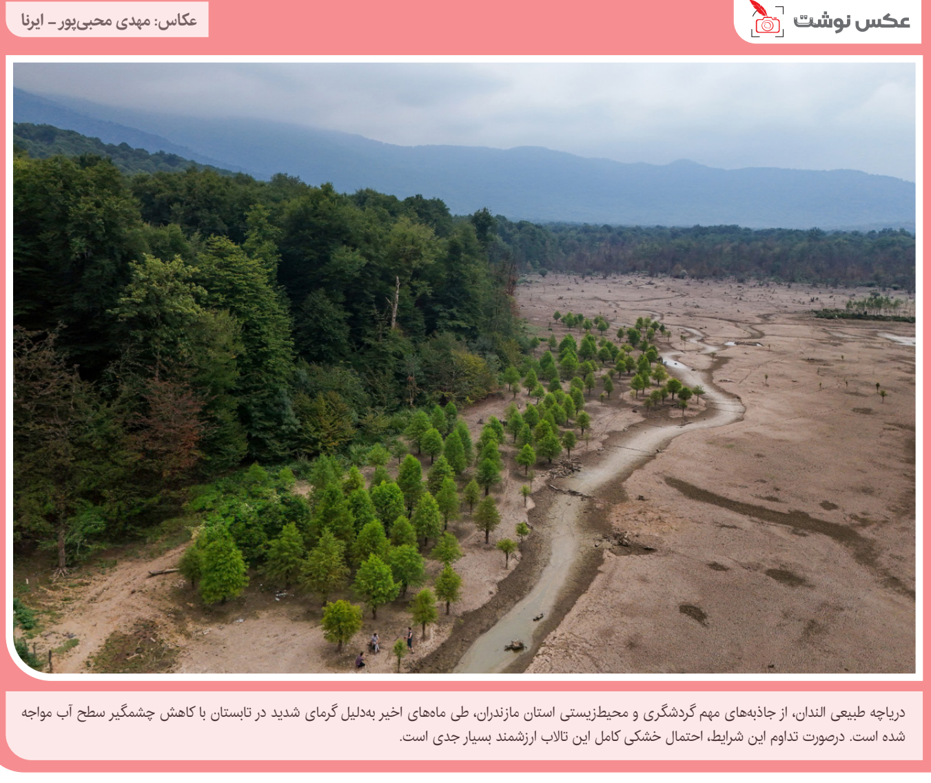
دریاچه طبیعی الندان، از جاذبه‌های مهم گردشگری و محیط‌زیستی استان مازندران، طی ماه‌های اخیر به‌دلیل گرمای شدید در تابستان با کاهش چشمگیر سطح آب مواجه شده است. در صورت تداوم این شرایط، احتمال خشکی کامل این تالاب ارزشمند بسیار جدی است.