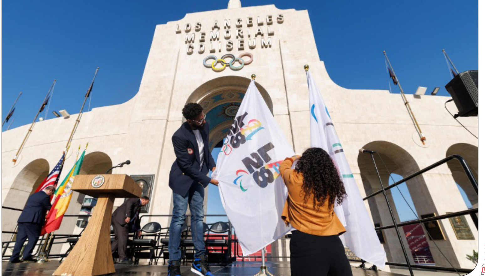
لس‌آنجلس ۲۰۲۸ بزرگ‌ترین رویداد ورزشی را به الگوی جهانی پایداری بدل می‌کند؟

سال گذشته و در طول برگزاری بازی‌های المپیک و پارالمپیک ایستامی ۲۰۲۴ به میزبانی پاریس، اقداماتی جدی در حوزه‌های پایداری و حفظ محیط‌زیست صورت گرفت. در این رویداد، ۹۸.۴ درصد از برق مصرفی از منابع انرژی باد و خورشیدی تأمین شد که رکوردی تازه در