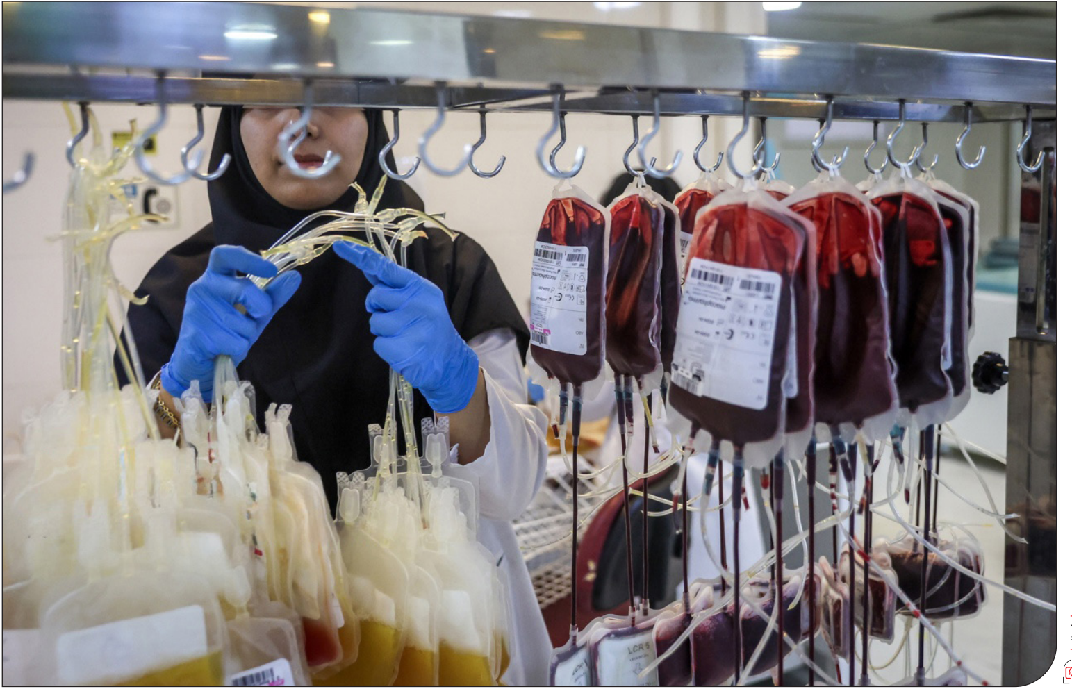
بررسی‌ها نشان می‌دهد تأمین خون در مراکز درمانی کشور با مشکل مواجه شده است

او در پایان هشدار می‌دهد: «تداوم کمبود خون در کشور، به‌ویژه در مناطق محروم، می‌تواند پیامدهای سنگینی برای بیماران تالاسمی و سایر نیازمندان به خون به‌همراه داشته باشد و ضرورت دارد دولت، نهادهای مدنی و مردم برای حل این بحران بیش‌ازپیش هم‌افزایی کنند.» اگرچه عرب دلایل دیگری برای کمبود خون برای بیماران تالاسمی ذکر می‌کند، اما معاون اجتماعی سازمان انتقال خون عدم مشارکت در این استان‌ها، به‌ویژه سیستان‌و بلوچستان، را موجب فشار به بیماران تالاسمی می‌داند و می‌گوید: «سازمان انتقال خون از طریق شبکه ملی خون‌رسانی کمبودهای استانی را جبران نمی‌کند، اما برخی مناطق همچون سیستان‌و بلوچستان همچنان با مشکلات بیشتری مواجه هستند. این استان به‌دلیل تعداد بالای بیماران تالاسمی یکی از مصرف‌کنندگان عمده خون در کشور است. با وجود تلاش‌ها، میزان مشارکت مردم در اهدای خون در این استان رضایت‌بخش نیست و همین امر