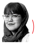
صدف سرداری | روزنامه نگار

سخنگوی دولت: موضع دولت از زمان اعطای مجوز به فرزند خلف خسرو آواز ایران روشن است