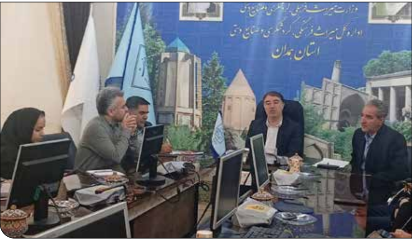
مدیرکل میراث فرهنگی، گردشگری و صنایع‌دستی استان همدان با اعضای هیات مدیره شرکت آب‌وفاضلاب استان همدان در جلسه‌ای در دفتر مدیرکل، در جریان بازدید از شرکت آب‌وفاضلاب استان همدان.

فرمانداری‌ها نیز تبعی‌هایی را برای تکمیل پرونده‌ها تشکیل داده‌اند. او خاطرنشان کرد: صرفاً معرفی روستاها کافی نیست و باید فعالیت‌های اجرایی در سطح جامعه و زیرساخت‌ها انجام شود. این روند می‌تواند طی ۳ تا ۴ سال موجب تجهیز