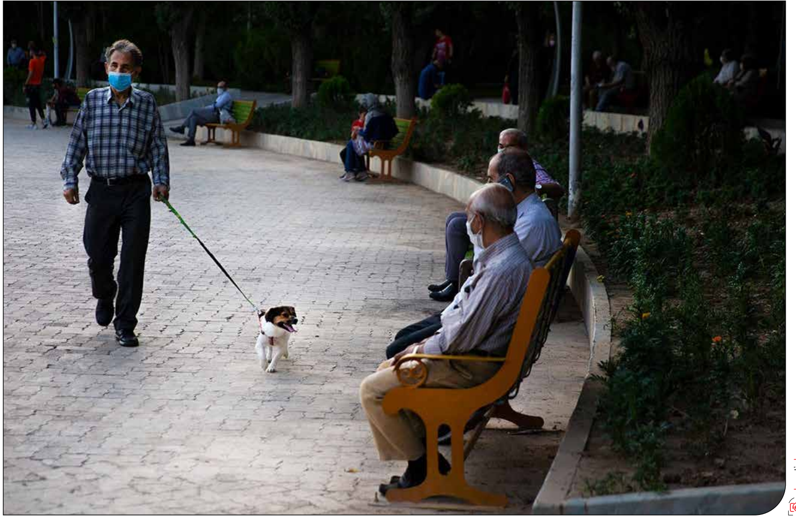
سگ گردانی ممنوع؛ دستوری که پیش از جنگ صادر شد و پافشاری بر آن ادامه دارد