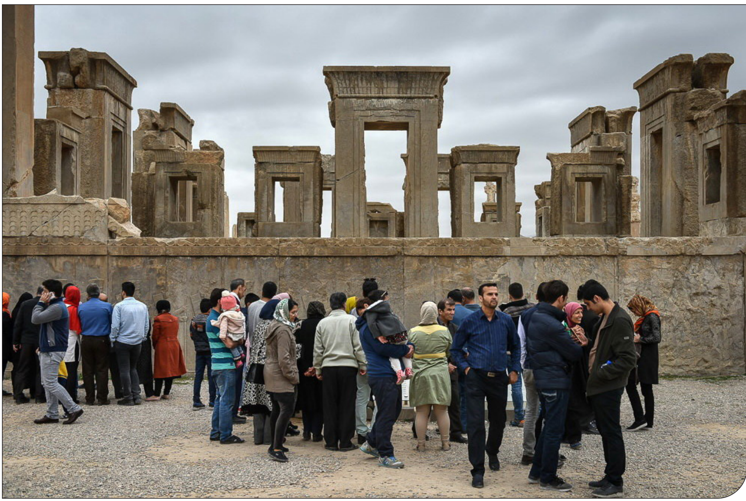
یک نماینده مجلس وزیر میراث‌فرهنگی را به چالش کشید