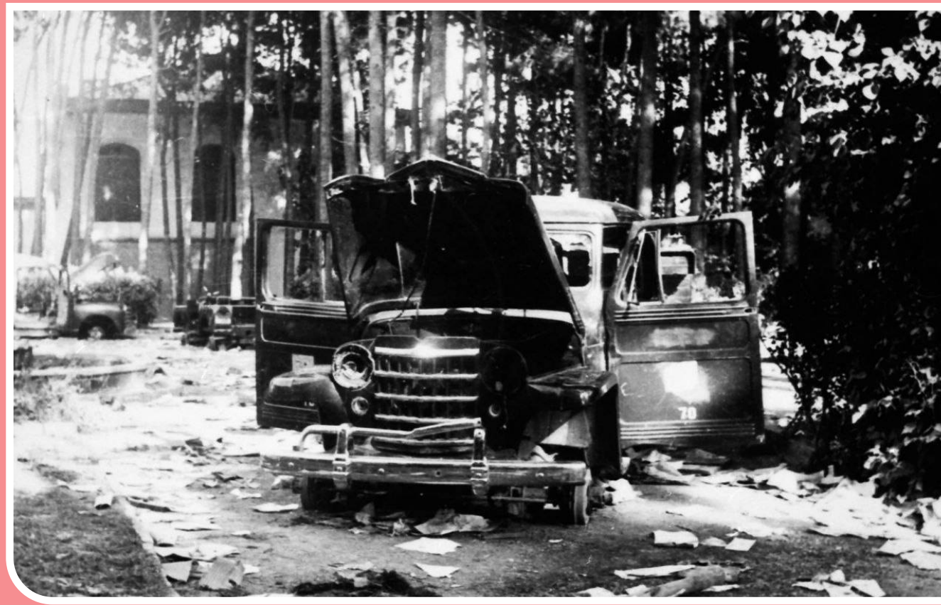
حمیدرضا محمدی - روزنامه‌نگار: این قاب، یکی از غم‌انگیزترین و غریب‌ترین ساعات آن روز تلخ و تاریک است. عصر آن روز داغ و شلوغ تابستانی شوم؛ دمدمای غروب چهارشنبه، ۲۸ مرداد ۱۳۳۲، و این‌جا؛ پایتخت، خیابان کاخ، خانه ویرانه «محمد مصدق»، ورق که برگشت و دلراهی آمریکایی و انگلیسی کارگر افتاد و الواط و ارادل با همراهی دست‌های پشت‌چرده دربار و بقیه گماشتگان و مزدوران، پیروزی‌شان را در رادیو اعلام کردند، باید سراغ رئیس‌الوزرا نیز می‌رفتند و حواش را کف دست‌شان می‌گذاشتند. به قلب تپنده نهضت ملی ریختند؛ روی دیوارها شعار نوشتند، غارت کردند، آتش زدند، جولان دادند و خاک‌اش را به توبه بستند. و البته نخست‌وزیر قانونی ایران که تا لحظه آخر ماند، ناگزیر از گریز شد.