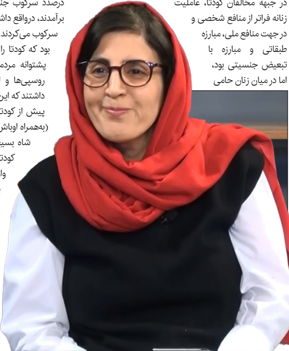
— | روزنامه‌نگار | —

در جبهه مخالفان کودتا و حامیان جنبش ملی‌شدن نفت‌کشگران حرفه‌ای و سازمان‌یافته زنان و زنان طبقه کارگر فعالیت می‌کردند. زنان حامی جنبش ملی‌شدن نفت در مخالفت با استبداد، استعمار/امپریالیسم و ارتجاع فعال بودند و هم‌زمان از مطالبات زنان شامل حقوق اجتماعی و حق رأی دفاع می‌کردند. درواقع، در جبهه مخالفان کودتا، عاملیت زنانه فراتر از منافع شخصی و در جهت منافع ملی، مبارزه با طبقاتی و مبارزه با تبعیض جنسیتی بود، اما در میان زنان حامی