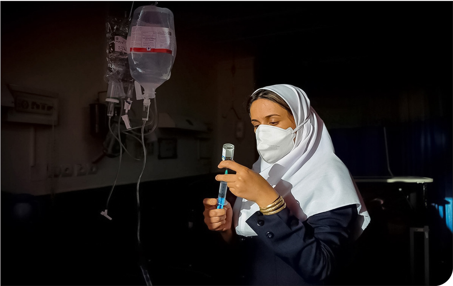
معاونان | ۱۵۰