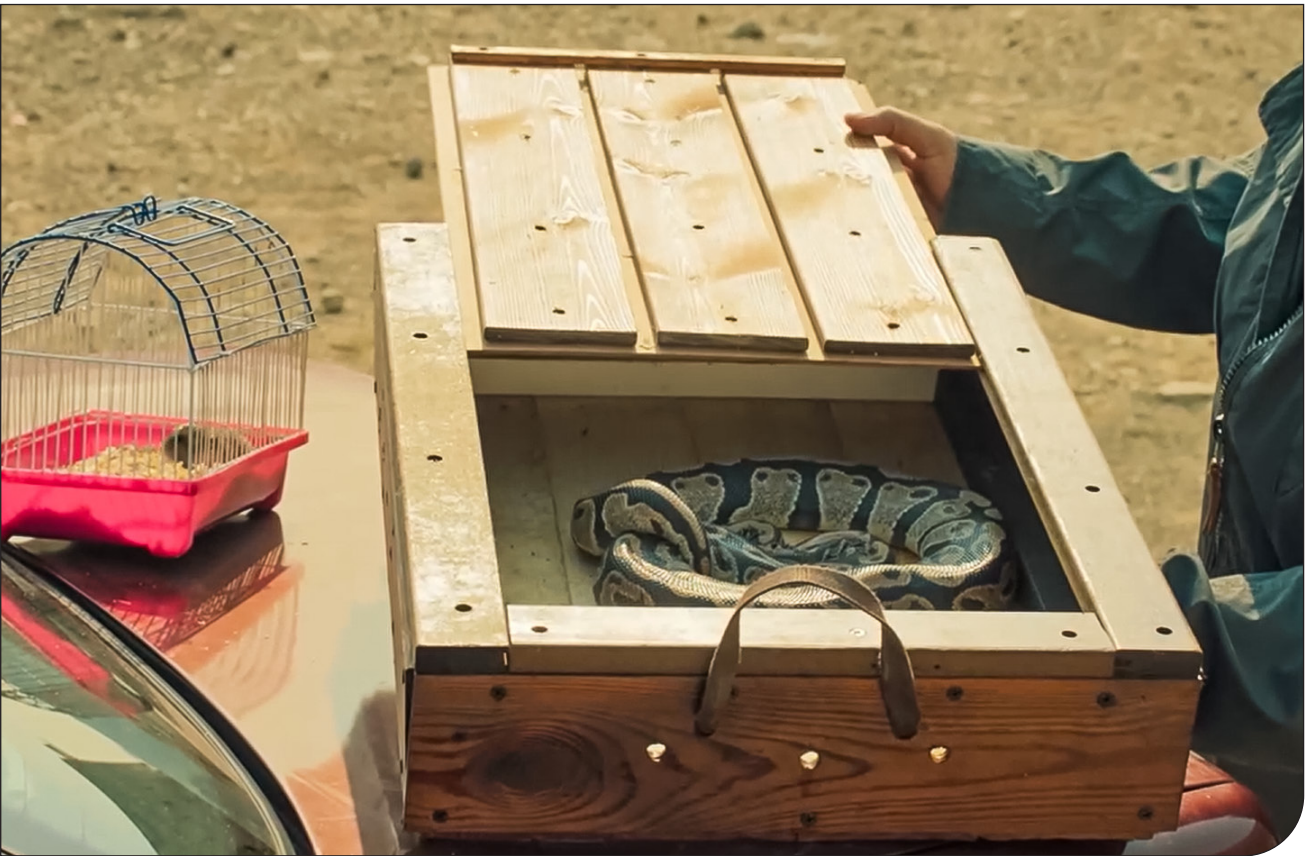
| سکانس سریال اجل معلق |