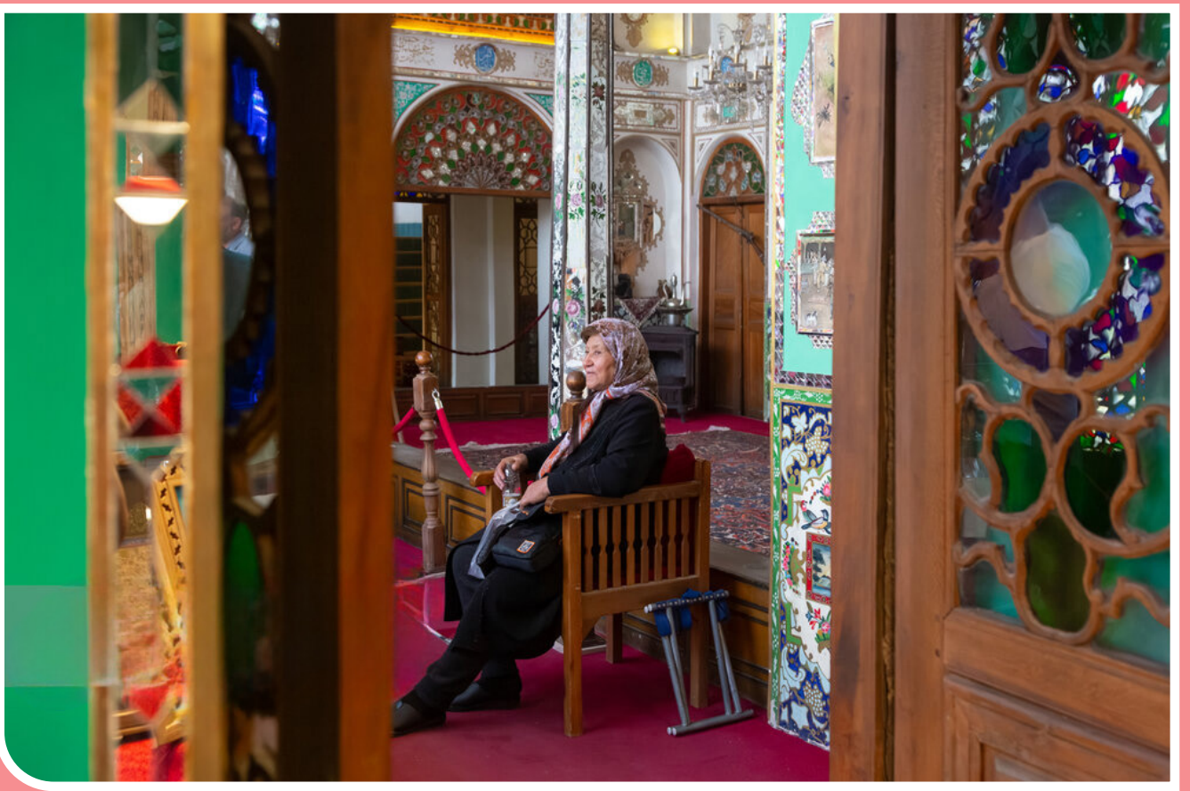
خانه مشیرالملک در اصفهان، یکی از آثار ارزشمند معماری ایرانی در دوره قاجار، از منظر تزئینات و به‌ویژه نقاشی و دیوارنگاری است. در تالارهای شاه‌نشین، آینه و حوضخانه نگاره‌های شاخص و متنوعی وجود دارد که تلفیقی از مفاهیم و مضامین ایرانی، غربی، روسی و اسلامی است. شاه‌نشین این خانه دارای یکی از بزرگ‌ترین یدری‌های تاریخی موجود در ایران است.