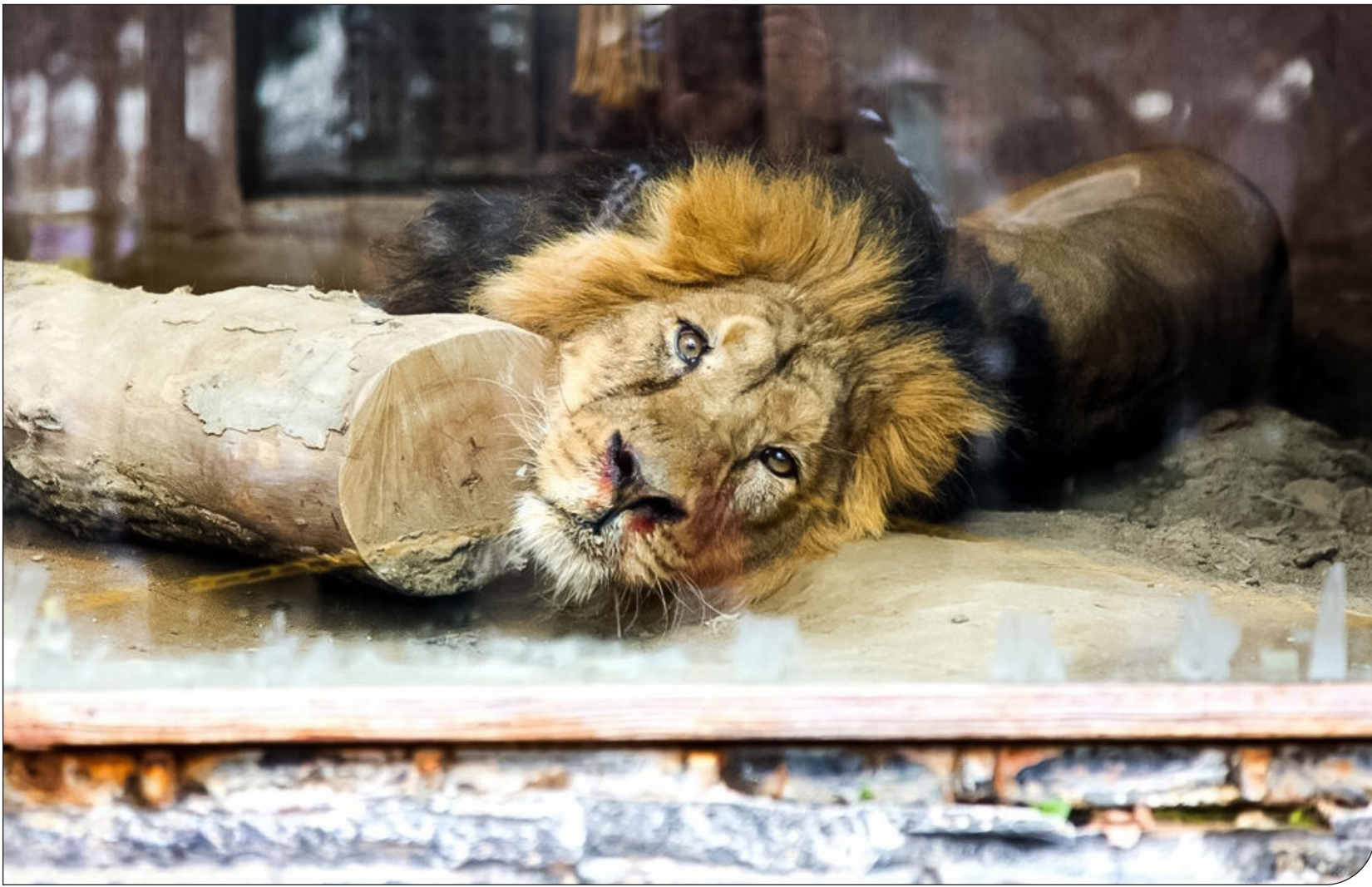
سجاد طوطی - فارس | ۱۴۰۳

چرا سازمان‌های حفاظت محیط‌زیست و دامپزشکی، هیچ گزارش کارشناسی مستقلی درباره مرگ این شیر منتشر نمی‌کنند؟