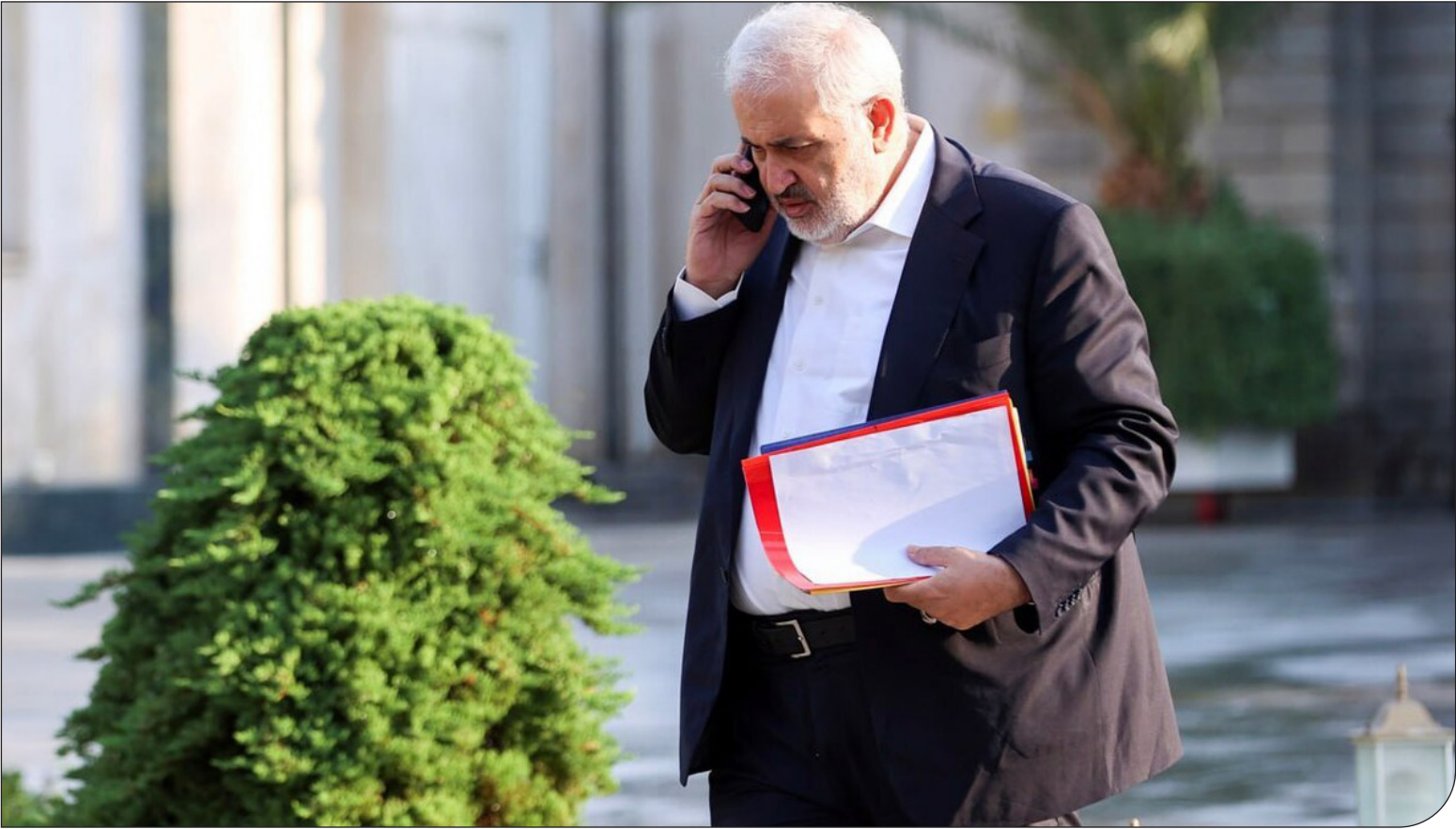
— ۱۰۰ —

۱۰۰ نماینده مجلس خواستار پاسخ‌گویی وزیر نیرو شدند