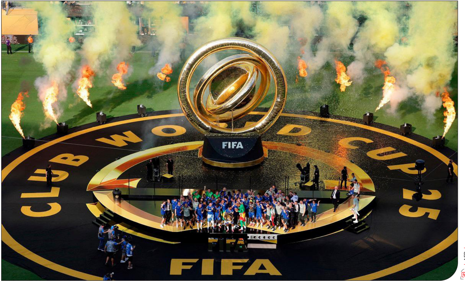
نگاهی به ضررهای زیست‌محیطی جام باشگاه‌ها