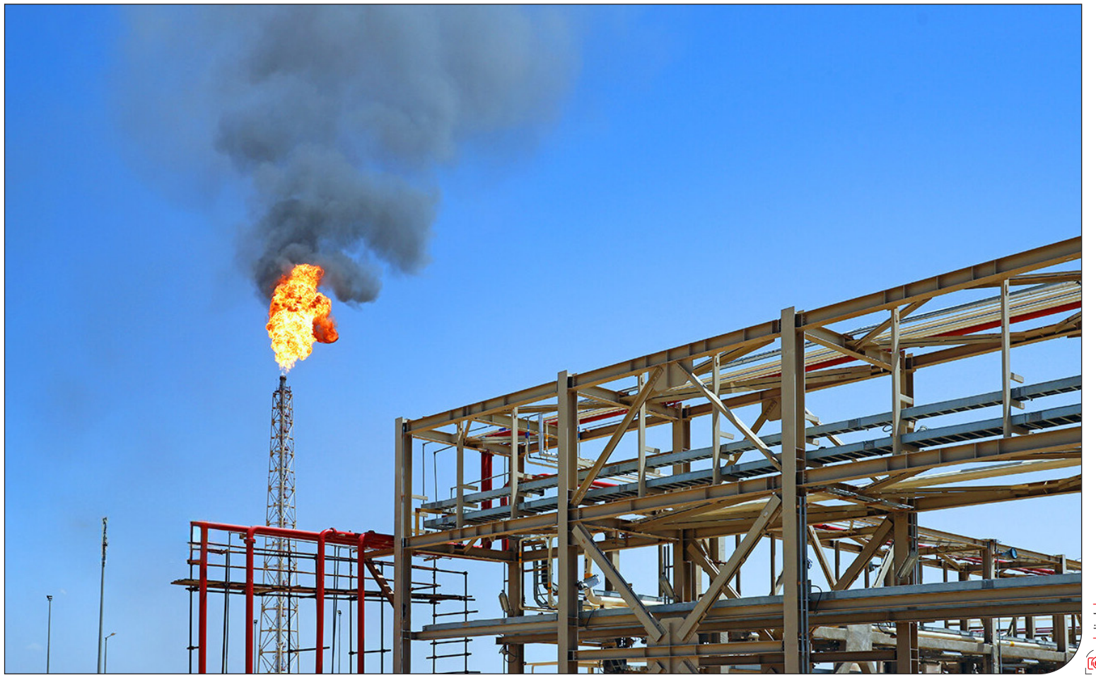
گزارش بانک جهانی از تولید ۳۸۹ میلیون تن آلودگی کربنی از طریق فلرها خبر می‌دهد