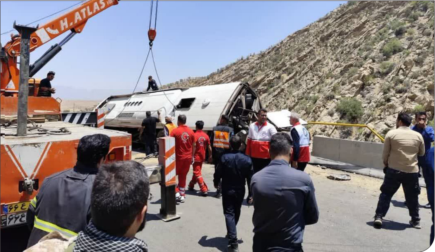
— ایپام ما

فاجعه حوادث جاده‌ای ایران باز هم تکرار شد