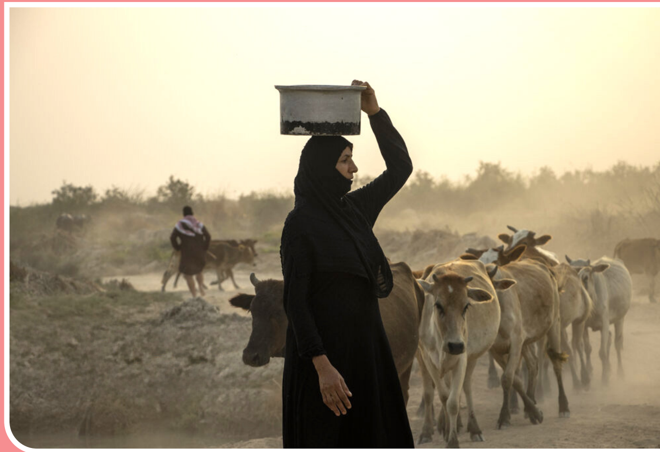
ساکنان روستاهای بخش مرکزی دهستان آهودشت شهرستان کرخه با بحران شدید کم‌آبی و آب لوله‌کشی ناپایدار مواجه‌اند. در روزهای اخیر، روستاهایی مانند مزرعه یک، مزرعه دو، حریرات و چند روستای دیگر برای چندین روز متوالی آب لوله‌کشی نداشته‌اند یا تنها دسترسی ناپایدار و محدود به آب داشته‌اند.