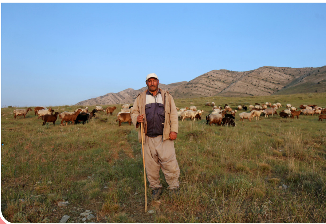
منطقه «گیل» در شمال شرق شیروان و در مرز ایران با ترکمنستان، یکی از بیلاخ‌های بکر و کمتر شناخته‌شده خراسان شمالی است که هرساله میزبان کوچ عشایر ایلات بیچارلو، میلانلو و شیخ‌امیر می‌شود.