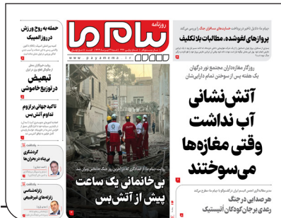
پیام ما دیروز