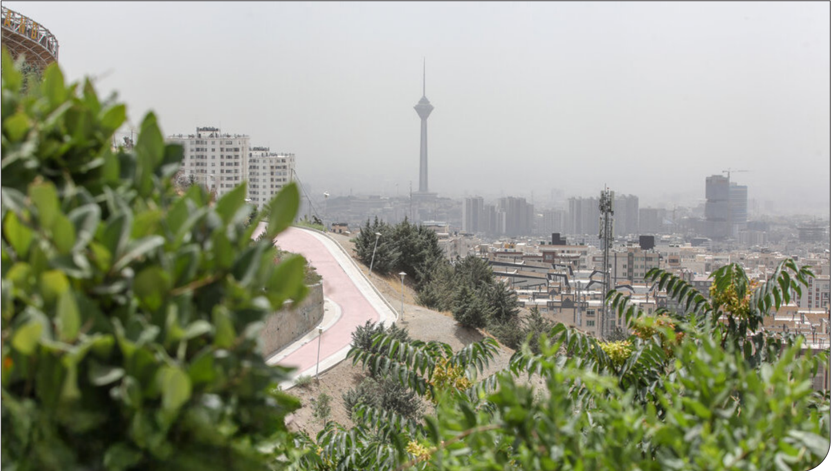
مریخی رنگه - اسپنا