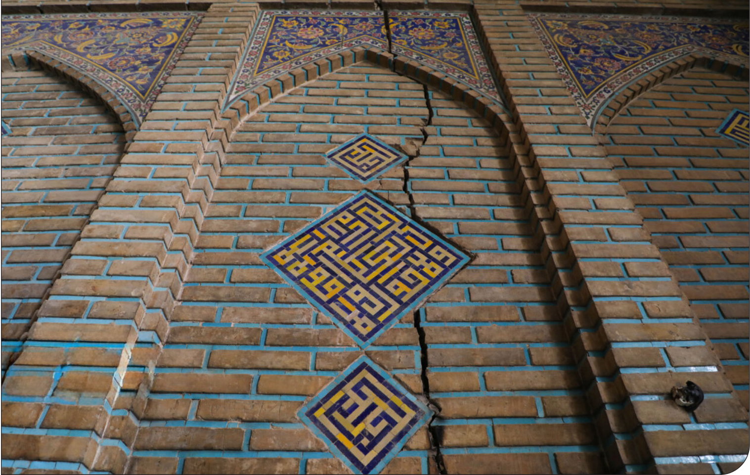
نمای نزدیک از سقف مسجد جامع اصفهان