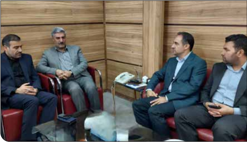
مدیرعامل آبفای اصفهان، میزبان بازدیدکنندگان آبفای اصفهان در نجف‌آباد

او افزود: تأمین پایدار زیرساخت‌هایی چون آب و برق،