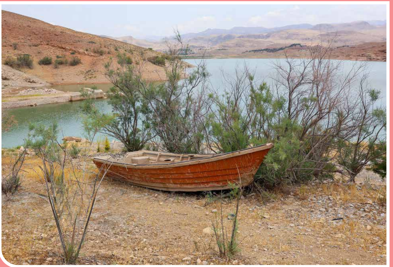
سد بتنی دو قوسی کارده با ارتفاع ۷۰ متر و طول تاج ۱۴۴ متر بر روی رود کارده احداث شده است. این سد که در ۴۰ کیلومتری مشهد قرار دارد، یکی از سدهای تأمین‌کننده آب مشهد است. حجم کلی سد کارده در تراز شمال ۳۰ میلیون مترمکعب است، اما در حال حاضر کمتر از ۱۰ درصد مخزن این سد آب دارد.