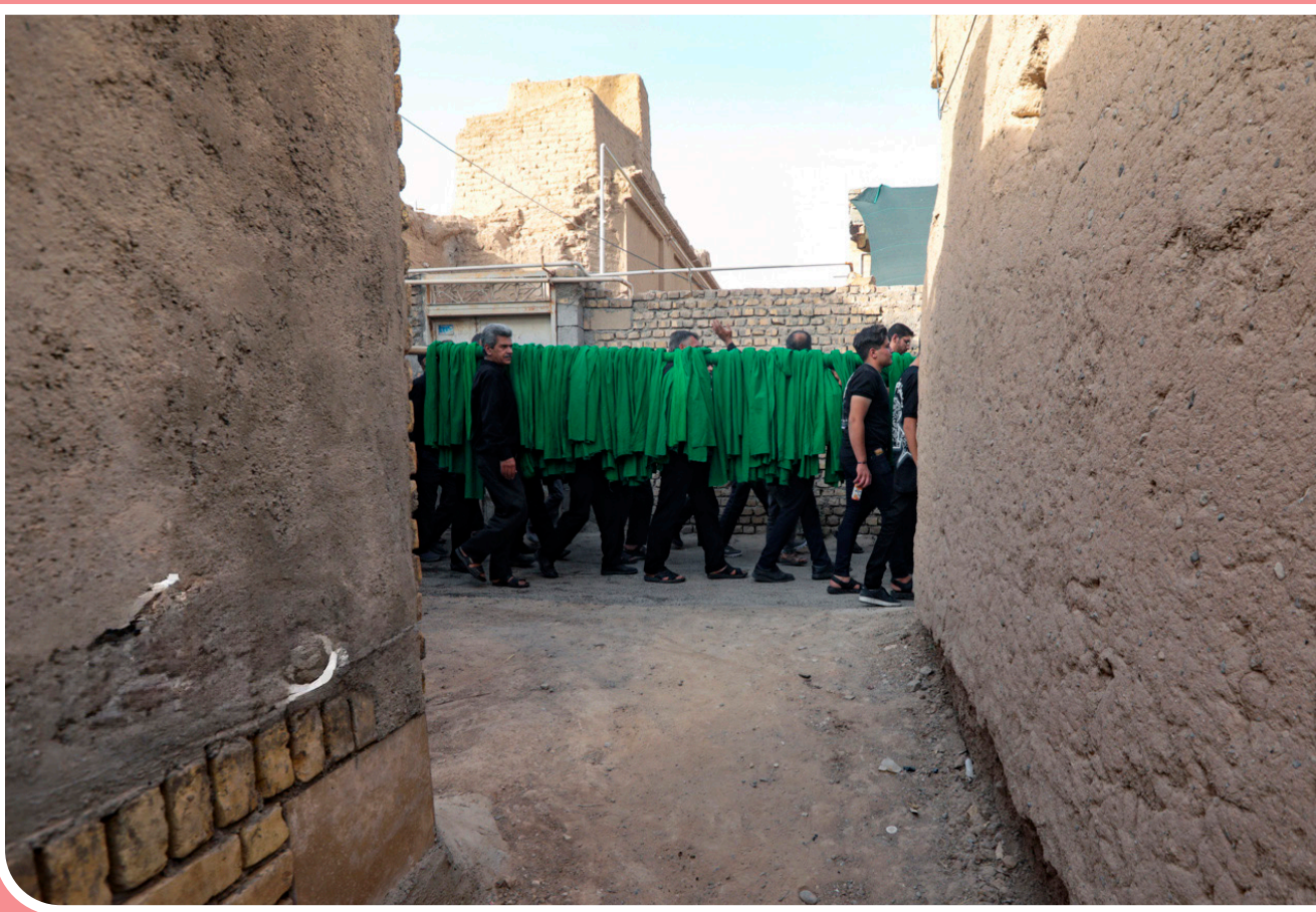
مراسم «محلله‌گردی» در یزد یکی از آیین‌های سنتی و مذهبی است که در ایام محرم، به‌ویژه در روز دوم آن، برگزار می‌شود. این مراسم قدمتی بیش از صد سال دارد و در برخی از محلات یزد از جمله مهریز برگزار می‌شود. در این آیین، دسته‌های عزاداری در کوچه‌ها و خیابان‌های محله به راه می‌افتند و به سینه‌زنی و عزاداری می‌پردازند.