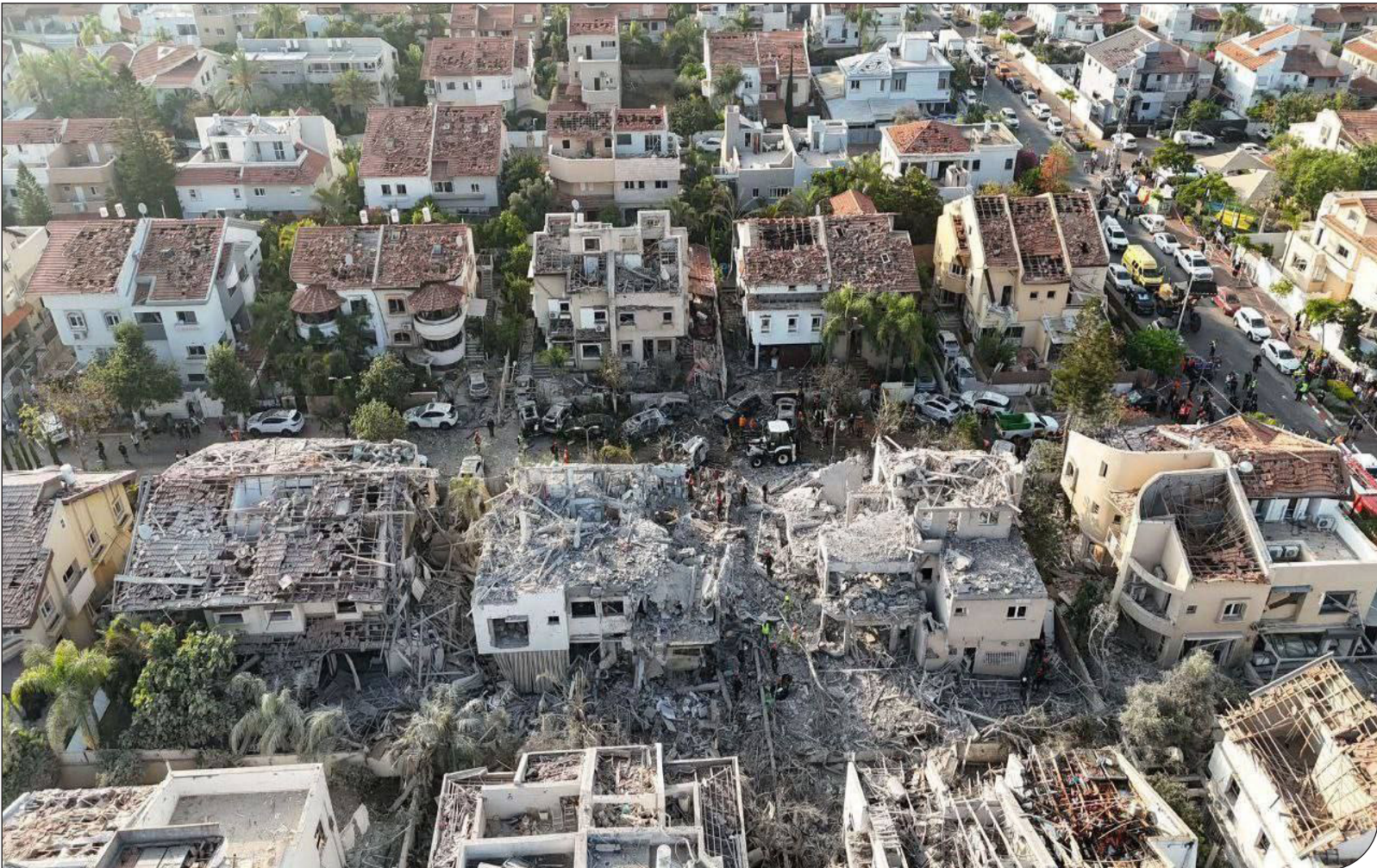
— ۳ —

ایپام | در پی حمله تروریستی و جنایتکارانه رژیم صهیونیستی به خاک کشورمان در بامداد روز جمعه، ۲۳ خرداد ۱۴۰۴، که منجر به شهادت جمعی از فرماندهان نظامی، دانشمندان هسته‌ای و شهروندان غیرنظامی از جمله زنان و کودکان شد، جمهوری اسلامی ایران با عملیات بی‌سابقه و حساب‌شده « وعده صادق ۳ »، قدرت بازدارنده و توانمندی نظامی خود را به جهان اثبات کرد. این عملیات که در شب پربرکت عید غدیر و با رمز مقدس « یا علی بن ابی‌طالب(ع) » انجام شد، نه تنها یک پاسخ نظامی، بلکه پیامی روشن درباره تغییر معادلات امنیتی منطقه و خطرزمهای جمهوری اسلامی ایران بود.