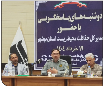
۱۹ خرداد ۱۴۰۴

تنها تالاب آب شیرین استان تالاب حله و نایبند است و با همکاری دستگاه‌های اجرایی همچون شرکت آب منطقه‌ای استان، استانداری و بسیج سازندگی لایروبی رودخانه حله انجام شده است، و باعبارت مالی شرکت آب منطقه‌ای شیب معکوسی که به دلیل رسوبات ایجاد شده است برطرف خواهد شد