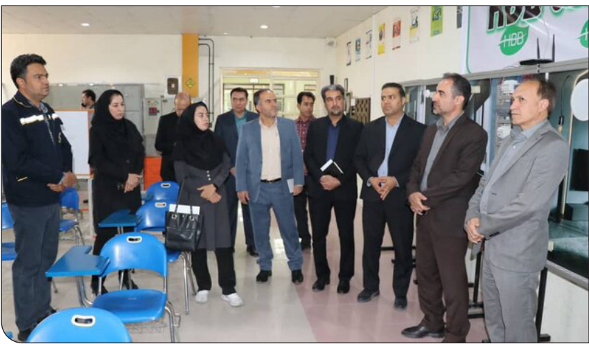
مدیرعامل شرکت آب منطقه‌ای مرکزی بیان کرد: برای استفاده از حجم آب موجود، ۱۰ برج در سد کمال صالح طراحی شده که ۳۰ لیتر بر ثانیه قابل بهره‌برداری است و نتیجه آن برداشت چهار تا پنج میلیون مترمکعب آب است.