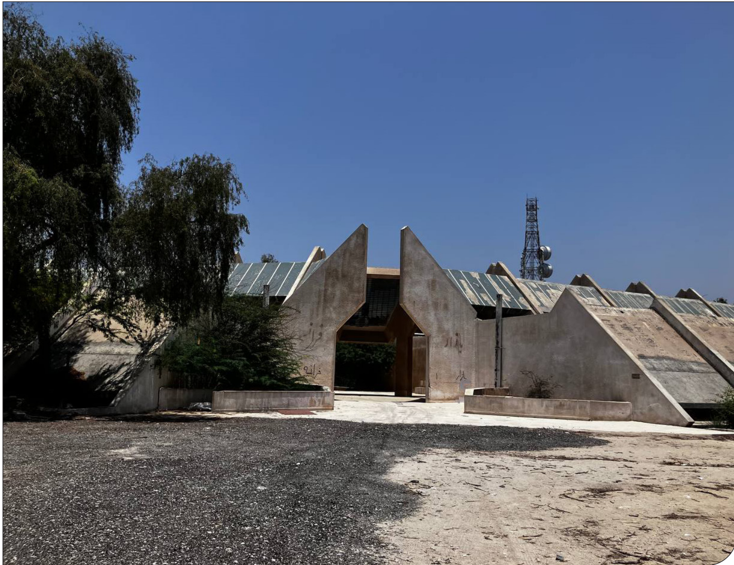
پنج سال پس از ثبت در فهرست میراث ملی اتفاق افتاد