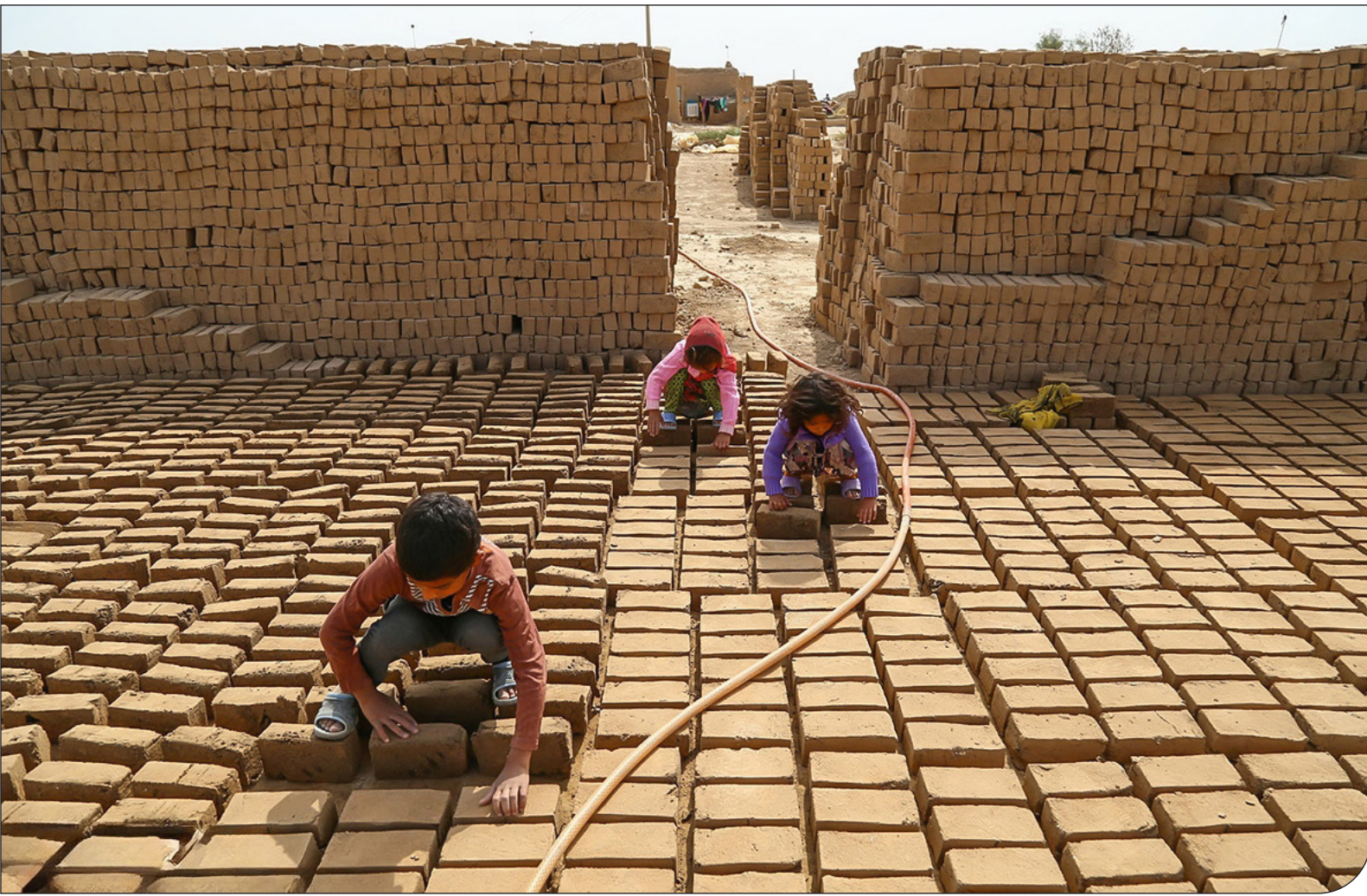
ویدئو خانگی - ایران |

در سال‌های اخیر و به‌خصوص پس از سال ۲۰۱۶، روند کاهش کار کودک در جهان متوقف شده است. این توقف نشان از آن دارد که شرایط اقتصادی در برخی از نقاط جهان، زندگی را برای کودکان دشوارتر کرده است. در ایران، تورم افسارگسیخته و اقتصاد دستوری، تأمین مایحتاج زندگی را دشوارتر ساخته و فرستادن کودکان به بازار کار توسط خانواده‌ها به آنان تحمیل می‌شود؛ زیرا این، آسان‌ترین شیوه برای دسترسی به پول است. قانون حمایت از اطفال و نوجوانان که استعمار اقتصادی کودکان را جرم‌انگاری کرده است، گزارشی از پیگرد جدی برای مبارزه با کار کودک را در مراجع قضایی ثبت نکرده است. با وجود چنین شرایطی ایجاد شورای ریشه‌کنی کار کودک، مشکل از سازمان‌های دولتی و غیردولتی مسئول در این زمینه برای مبارزه جدی با کار کودک بیش‌ازپیش به ضرورتی مبرم بدل شده است. هر ساله به مناسبت روز جهانی مبارزه با استثمار کودکان، همایش‌ها، سمینارها و جلسات متعددی برگزار می‌شود که متأسفانه تاکنون تأثیر چندانی در بهبود وضعیت کودکان کار نداشته است. چرخه تولید کودک کار بدلیل وضعیت رو به وخامت اقتصادی، پرشتابتر از ندهای مبارزه با کار کودک عمل کرده و می‌کند. برگزاری سمینارها، نشست‌ها و مراسم تخصصی و گاه نمایشی، کمک چندانی به باز کردن گره از کلاف سر در گم کار کودک نمی‌کند. کار کودک امروز و فردا نمی‌شناسد. جوامع انسانی در گذشته‌های دور از نیروی کار کودک متناسب