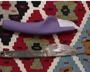
قلاب بازطراحی‌شده قالبیافی