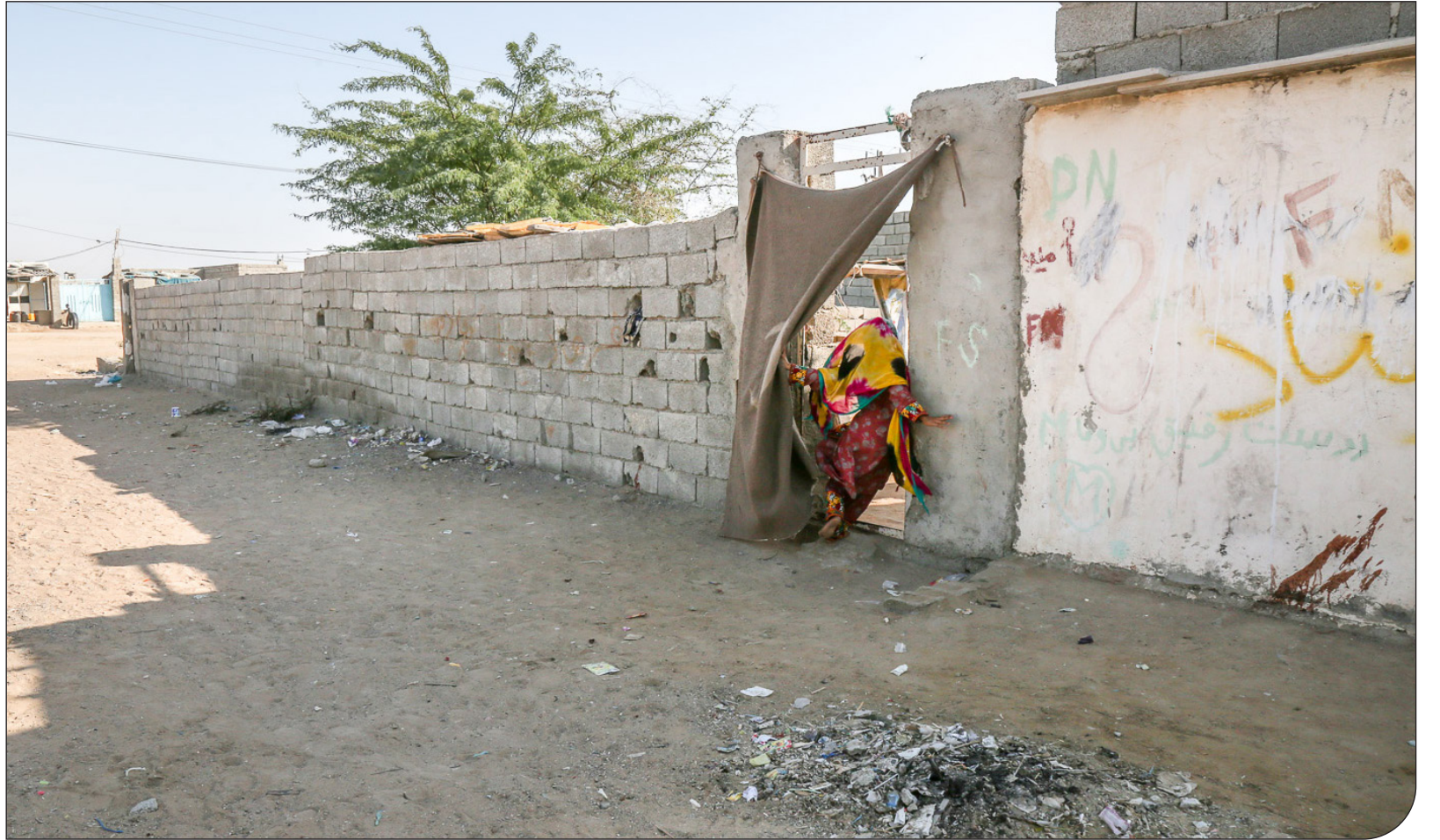
تیمبه خونی - شفتا

بخشدار سابق «چانف»: مردم نمی‌دانند چه کنند؛ نه پادزهری وجود دارد و نه تلاشی برای مهیا کردن آن می‌شود