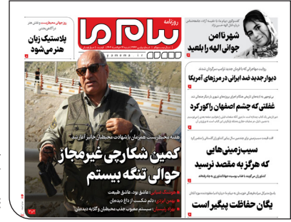
پیام ما دیروز