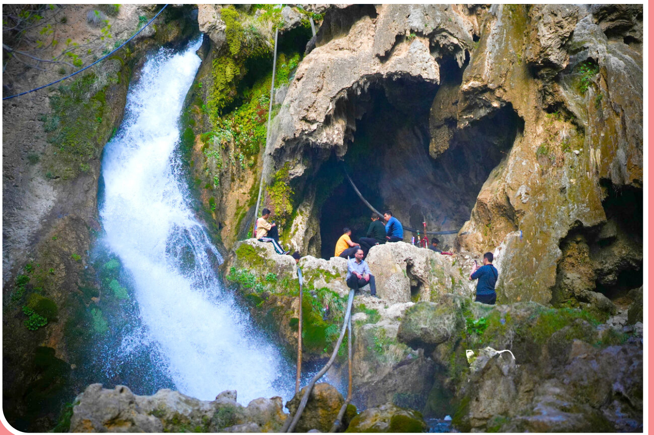
«آبشار آتشیگاه» لردگان، طولانی‌ترین آبشار ایران، یکی از شگفت‌انگیزترین جاذبه‌های طبیعی کشور است که به «آبشار مینیاتوری» شهرت دارد. این آبشار زیبا در دره‌ای سرسبز و دل‌انگیز به طول سه کیلومتر واقع شده است و با حرکات موج‌دار خود، سکوت طبیعت را می‌شکند.