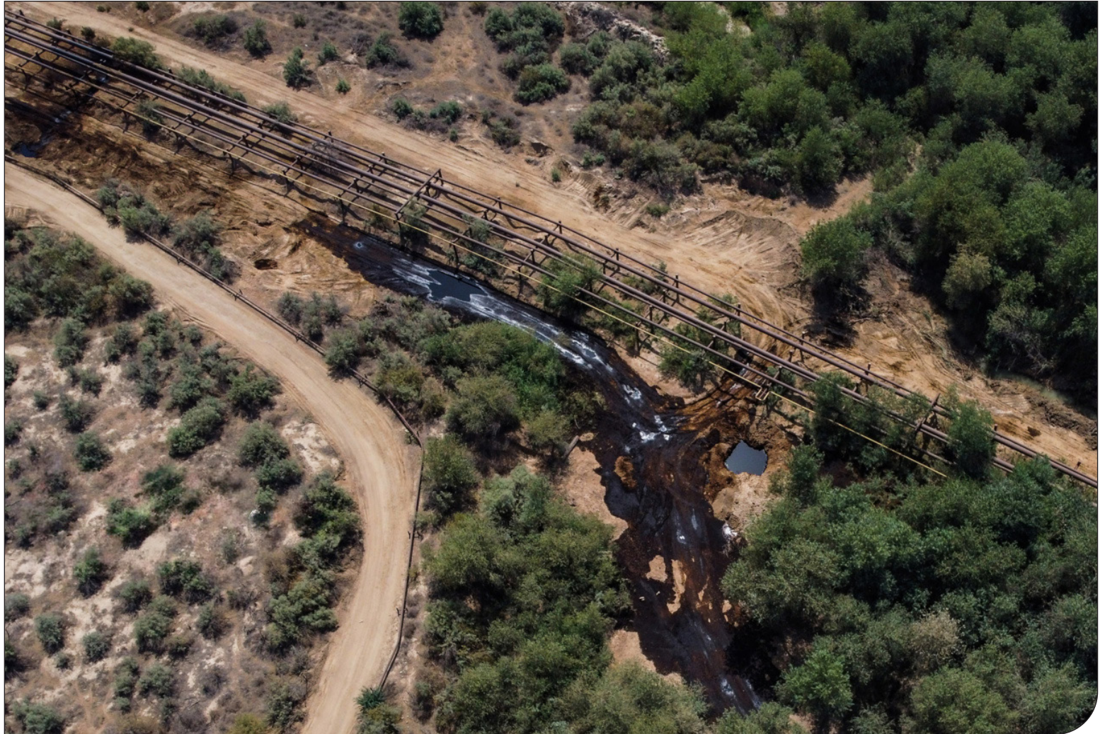
رودخانه آلوده در جنوب ایران

مدیر انجمن مهرورزان زیست‌بوم مارون: آلودگی نفتی گسترش پیدا کرده و اکنون به رودخانه جراحی رسیده است