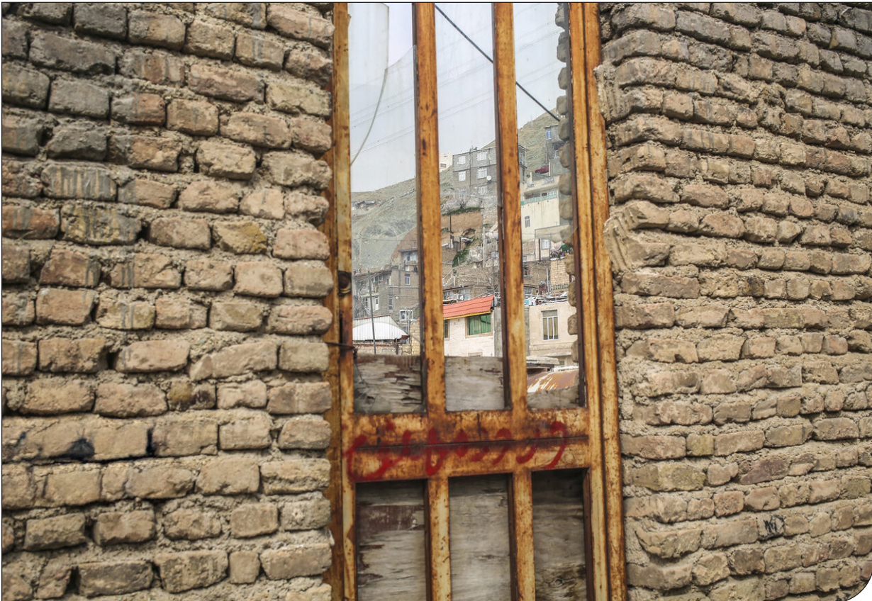
معماری کهن تهران - ایران

ایپام ما| تهران حریم مشخصی ندارد. مرزهای شهری پایتخت سال‌هاست به‌طور غیررسمی فراموش شده و ساخت‌وسازهای غیررسمی، اسکان‌های تصرفی، توسعه‌های بی‌ضابطه و فقدان نظارت یکپارچه، سیمای کلانشهر را آشفته‌تر از همیشه کرده است. حریم تهران که نقش حیاتی در حفظ محیط‌زیست و کنترل گسترش بی‌رویه شهر دارد، به‌دلیل ابهام در مرزهای مدیریتی با شهرستان‌های اطراف، در معرض ساخت‌وسازهای غیرمجاز و زمین‌خواری گسترده قرار گرفته است. در هفته‌های اخیر، موضوع حریم تهران به یکی از چالش‌های مدیریت شهری تبدیل شده است. حریم تهران با وسعتی بالغ‌بر پنج هزار و ۹۱۷ کیلومترمربع، حدود ۹ برابر محدوده شهری پایتخت را در بر می‌گیرد و نقش حیاتی در حفاظت از منابع طبیعی، کنترل توسعه شهری و جلوگیری از ساخت‌وسازهای غیرمجاز ایفا می‌کند. اما اکنون با لغو بخشنامه مدیریت یکپارچه حریم توسط وزارت کشور، نگرانی‌ها درباره توسعه بی‌ضابطه و ساخت‌وسازهای غیرمجاز بار دیگر افزایش یافته است. با توجه به وضعیت فعلی، کارشناسان هشدار می‌دهند اگر مدیریت حریم به شهرداری بازنگردد، تهران به شهری بی‌حریم تبدیل خواهد شد که توسعه بی‌ضابطه و ساخت‌وسازهای غیرمجاز در آن افزایش می‌یابد. این موضوع تعادل محیط‌زیستی و اجتماعی را تهدید می‌کند و آینده توسعه پایدار پایتخت را نیز در معرض خطر قرار می‌دهد