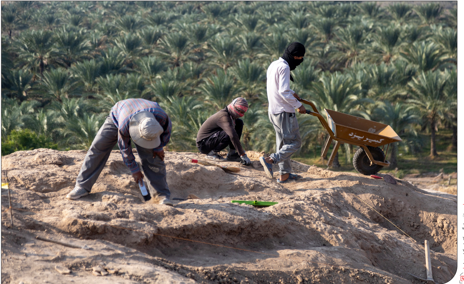
درباشی از گروه کاوش کنارصندل

نگته دیگری که معاون میراث‌فرهنگی کشور در اظهارات خود به آن اشاره نکرده، میزان آسیبی است که به این محوطه وارد شده است. در تصاویر و ویدئوهای موجود از محل اجرای پروژه، آثار و سفالینه‌هایی دیده می‌شود که به‌وضوح تأیید می‌کند که ماشین‌های راه‌سازی قرار است علاوه‌بر تسطیح محوطه برای ساخت سالن ورزشی، پروژه تعریض جاده مجاور روستا را هم پیش ببرند. به‌گفته مدیر پایگاه میراث‌فرهنگی جیرفت، پروژه فعلاً متوقف شده است و باید دید وزارت میراث‌فرهنگی چگونه این محک تاریخی را پشت سر خواهد گذاشت.