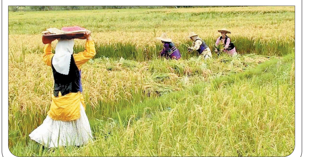
ایرانیان وجود ندارد.

قریب‌به‌اتفاق باستان‌شناسان جهان معتقدند اولین بار این ایرانیان بودند که کشاورزی را در جهان به‌وجود آوردند. کشاورزی برخلاف صیادی و شکار و گردآوری گیاه برای غذا است که نیازمند حرکت همراه با فصول و حیوانات است؛ پس وقتی انسان کشاورزی می‌کند، باید یکجانشین شده باشد. پس نیاکان شما کسانی بودند اما بدون آگاهی جمعی چگونه می‌توانیم راه آیندمان را پیدا کنیم؟ اگر قرار بود در جهان کشاورزی به‌وجود بیاید، خردمندانه و عاقلانه آن بود که در یک اقلیم مدیترانه‌ای که احتیاج به آب نداشته باشد، به‌وجود آید؛ یعنی جایی که در زمستان‌ها و در مواقع کمبود باران دچار مشکل نشویم. چگونه توانستیم شکرگدا و قناری را به‌وجود بیاوریم که بتواند آب را از اعماق زمین به پای خودمان بیاورد و کی و کاریز را به‌وجود بیاوریم؟ نیاکان ما در حال یادگیری از زمین و زمان بودند و اینگونه توانستند در ۱۵ هزار سال قبل تمدن کاربزی بسازند. کاربزی چنان بذال بود که اکوسیستم می‌ساخت، هرکجا که یک کاربزی بود، اکوسیستم گیاهی و حیوانی خود را به‌وجود می‌آورد.