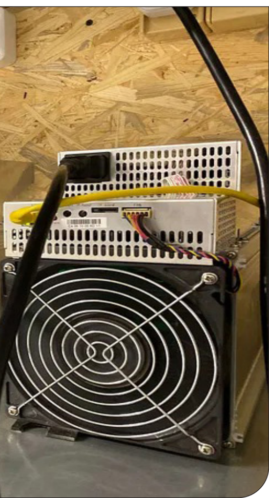
— 100 —