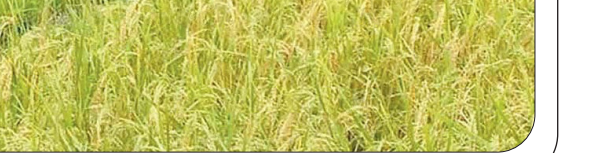
ایرانیان وجود ندارد.

عجیب نیست که ما هیچ‌کدام نمی‌دانیم که چنین سرنوشتی در گذشته مملکت ما اتفاق افتاده است. اگر ما ندانیم نیاکانمان در گذشته در این سرزمین کم‌باران چه کار کردند، چگونه می‌توانیم کار درست‌تری انجام دهیم؟ بخشی از این سرگردانی ما در برخورد با مسائل با محیط‌زیستی، به‌دلیل این نادانی تاریخی است. گذشته چراغ راه آینده است. پس چرا ما این چراغ راه آینده را صدبار به زمین زدیم و شکستیم و حاضر هم نیستیم که به یاد داشته‌ها را جمع کنیم؟ کنفوسیوس می‌گوید «گذشته چون که به پاک آید و فهم شود، دیگر گذشته نیست بلکه حوالی و آینده است.»