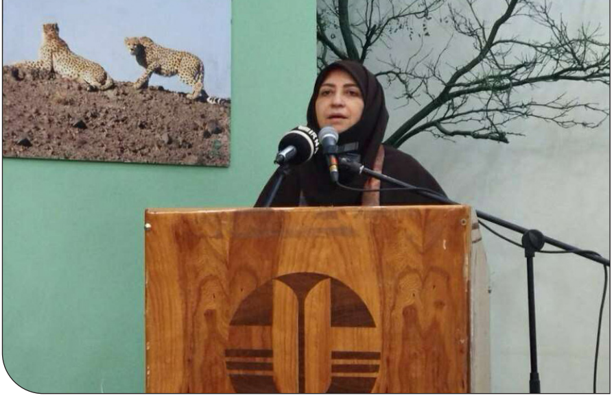
ایزابیل ماسلر در نبرد با تابوها

رئیس سازمان حفاظت محیط‌زیست ضمن اشاره به اهمیت تأمین منابع و نیروی انسانی در حوزه محیط‌زیست طبیعی گفت: مسائل مربوط به محیط‌زیست انسانی از جمله آلودگی‌ها و چالش‌های این حوزه نیز باید به‌طور جدی پیگیری شوند. انصاری اقداماتی همچون افزایش نیروی انسانی، اصلاح قانون حمل سلاح، حمایت از محیط‌بانان، اختصاص عوارض آلودگی به امور محیط‌زیستی از طریق صندوق ملی محیط‌زیست، افزایش امکانات پایشی و استفاده از فناوری‌های نوین را جزو اولویت‌های سازمان برشمرد. او همچنین با اشاره به اینکه حل تمامی مشکلات در کوتاه‌مدت امکان‌پذیر نیست، افزود: تحقق اهداف سازمان تنها از طریق برنامه‌ریزی دقیق توسط معاونت‌های تخصصی و اجرای تدریجی آنها در بازه زمانی میان‌مدت امکان‌پذیر است.