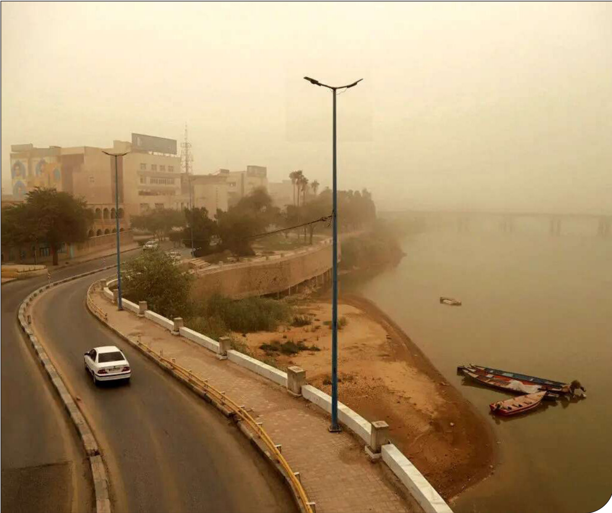
یک تصویر از یک خیابان در کردوغبار

کردوغبار آمده از عراق و گردوخاک محلی، زندگی در نیمه غربی کشور را به تعلیق درآورد