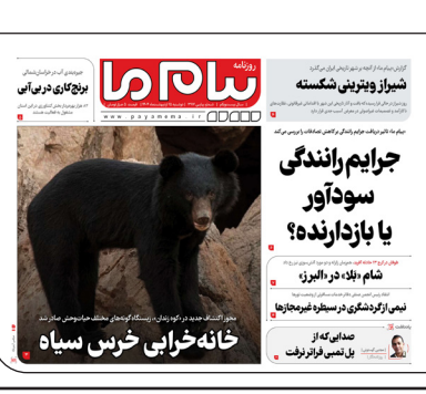
پایام ما دیروز