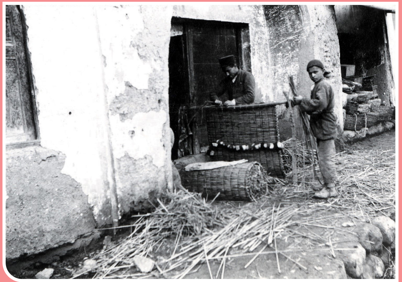
این تصویر مربوط به یک کارگاه حصیربافی است. تصویر در دامغان و در دوره پهلوی اول توسط «اریش فریدریش اشمیت» به ثبت رسیده است.