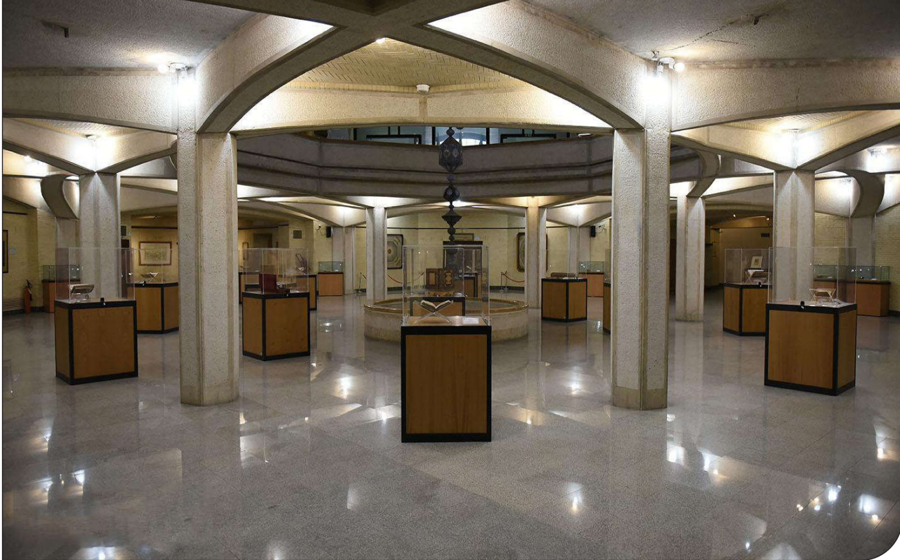
اراضی مکتب تهران [۱۶]