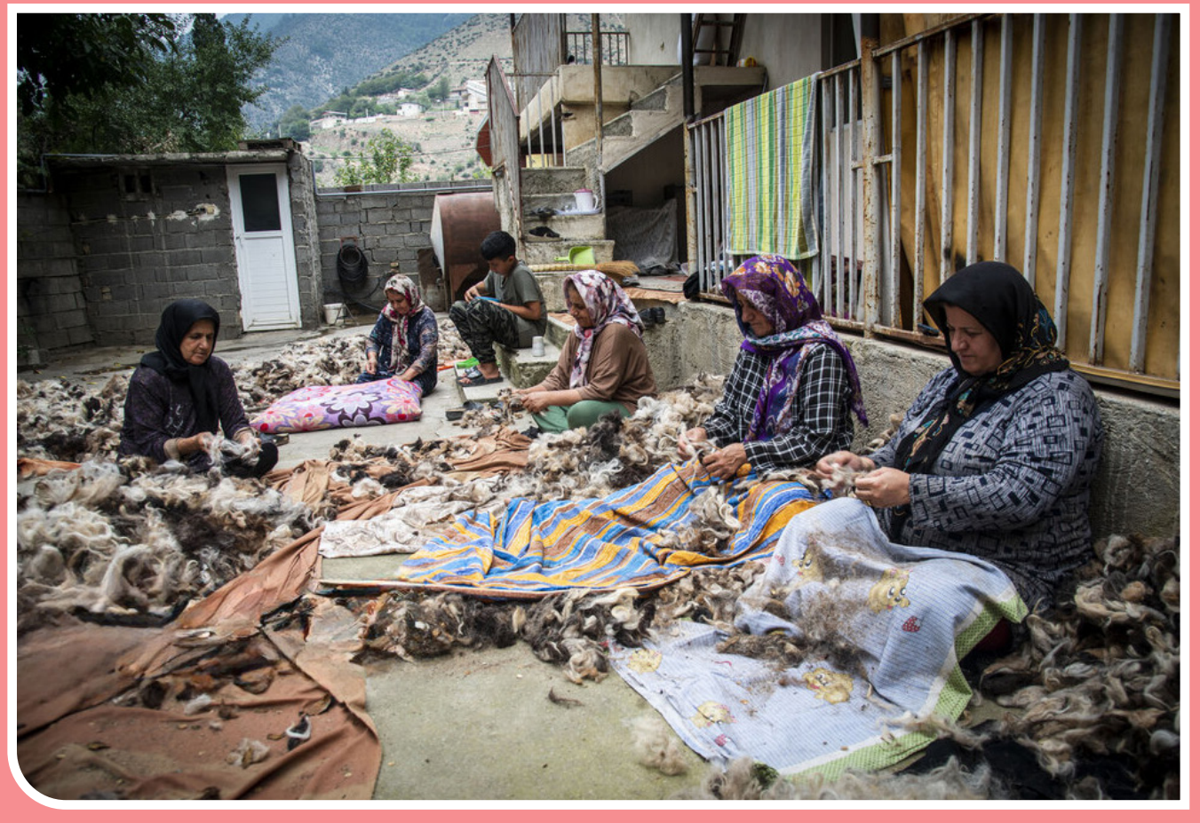
با فرارسیدن فصل بهار و افزایش تدریجی دمای هوا، دامداران منطقه سوادکوه شروع به پشم‌چینی دام‌های خود می‌کنند و بسیاری از دامداران با انجام این عمل علاوه‌بر استفاده از پشم‌های چیده‌شده برای تولیدات خانگی مانند تشک، نخ و زیرانداز به‌دنبال از بین بردن کت‌ها و کاهش میزان بیماری‌های پوستی در گله خود هستند.