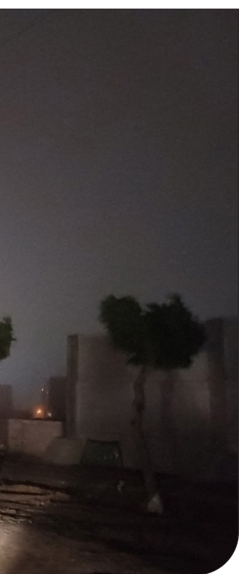
ایسنا | 60

پس از چندین روز تلاش شبانه‌روزی و جست‌وجو برای یافتن آخرین بقایای آسیب‌دیدگان، به‌طوری‌که در دو روز اخیر هیچ‌گونه بقایی از نفرات آسیب‌دیده یافت نشد. با هماهنگی ستاد پیشگیری، هماهنگی و فرماندهی عملیات پاسخ به بحران استانداری، در شامگاه ۱۳ اردیبهشت‌ماه، پایان عملیات جست‌وجو و نجات اعلام می‌شود. جمعیت هلال‌احمر هرمزگان اعلام کرد عملیات جست‌وجو و نجات در پی حادثه انفجار بندر شهیدرجایی، پس از چندین روز تلاش بی‌وقفه اندک‌گزارن، شامگاه ۱۳ اردیبهشت‌ماه به پایان رسید. جمعیت هلال‌احمر استان هرمزگان اعلام کرد: به اطلاع مردم شریف می‌رساند با توجه به حادثه غم‌انگیز انفجار در بندر شهیدرجایی بندرعباس در تاریخ ۱۴۰۴/۲/۱۶، نیروهای عملیاتی این جمعیت از همان لحظات اولیه وقوع حادثه در کنار سایر دستگاه‌ها و عزیزان خدمت‌رسان، مشغول ارائه خدمات به آسیب‌دیدگان و متاثرین از این حادثه بودند. عملیات جست‌وجو و نجات با تمام توان توسط نیروهای عملیاتی در سخت‌ترین شرایط، بدون وقفه دنبال شد. پس از چندین روز تلاش شبانه‌روزی و جست‌وجو برای یافتن آخرین بقایای آسیب‌دیدگان، به‌طوری‌که در دو روز اخیر هیچ‌گونه بقایی از نفرات آسیب‌دیده یافت نشد. با هماهنگی ستاد پیشگیری، هماهنگی و فرماندهی عملیات پاسخ به بحران استانداری، در شامگاه ۱۳ اردیبهشت‌ماه، پایان عملیات جست‌وجو و نجات اعلام می‌شود. گزارش اقدامات صورت‌گرفته در اختیار مسئولین ذی‌ربط قرار گرفته است تا به‌نجو مقتضی به استحضار مردم شریف رسانده شود. جمعیت هلال‌احمر استان هرمزگان بار دیگر این ضایعه دردناک را به مردم عزیز ایران و خانواده‌های جان‌باختگان تسلیت عرض می‌کند و برای بازماندگان از خانواده سبحان صبر جزیل مسئلت دارد. | ایرنا