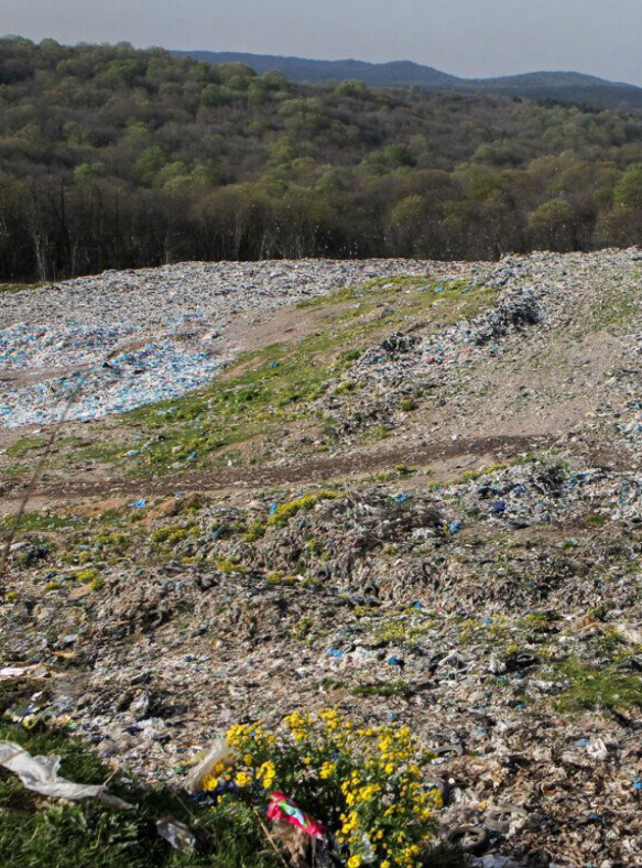
ارزیابی عملکرد و چالش‌های مدیریت پسماند در ۱۴۰۳ نشان می‌دهد

کلیه مشکلات قانونی و اصلاحیه قانون مدیریت پسماند الف) مشکلات قانونی و اصلاحیه قانون مدیریت پسماند یکی از اتفاقات مهم در سال ۱۴۰۳، پیگیری ابراهیم رئیسی به انجام رساند. این کارگروه با هدف طراحی سیاست‌های کلان، بودجه‌ای و حکمرانی مدیریت پسماند تشکیل شد. اما مسأله‌ها، به‌دلیل تلاطم‌های حکمرانی و تغییرات اساسی در دولت، این کارگروه منحل شد و تمام تلاش‌ها بدون نتیجه ماند.