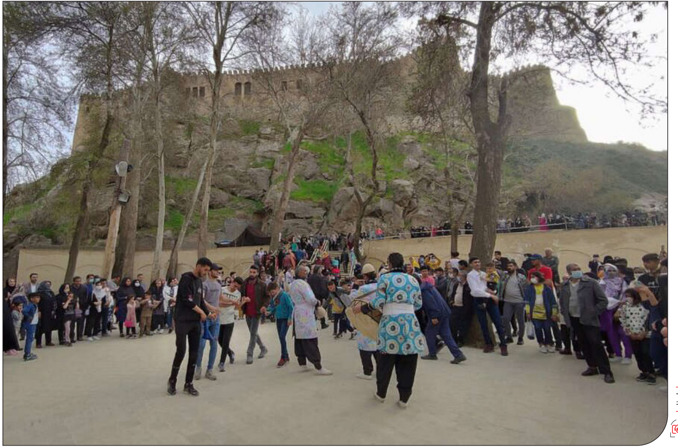
معاون گردشگری کشور در میان ۱۳۰ تورگردان بین‌المللی عنوان کرد