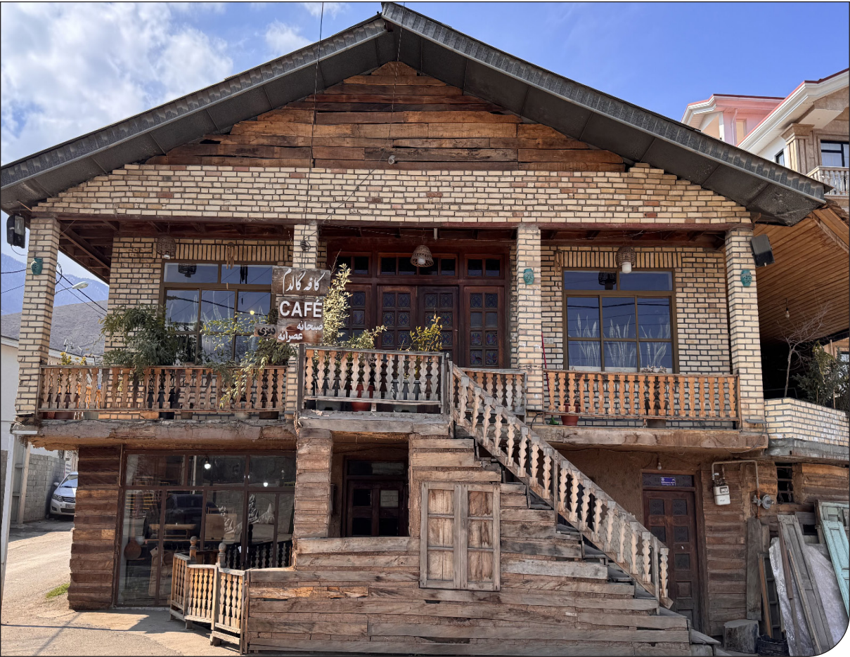
— از چپ —

رئیس‌جمهور خاطر‌نشان کرد: در روند ساختاری ارتش ارتحرافی ایجاد نشده است. در ارتش سلسله‌مراتب و جایگاه‌ها و رتبه‌ها حفظ شد و این به برکت دستور امام خمینی برای جلوگیری از انحلال ارتش بود. دشمن در اول انقلاب تلاش داشت ارتش را منحل کند تا نوظطه‌های خود را اعمال کند. ولی ارتش با قدرت ماند و در جنگ بیش از ۴۸ هزار شهید را تقدیم کرد. بیش از ۲۰۰ هزار جانباز را در جنگ تحمیلی تقدیم کرد. این نشان حضور ارتش در تمام چپه‌های جنگ بود و اگر این عزیزان نبودند، دشمن دنبال تسخیر کشور و از بین بردن انقلاب بود، ولی ارتش خواب آنها را آشفته کرد.او ادامه داد: اوایل انقلاب اسلامی، تجهیزات ارتش وابسته به بیگانگان بود، اما امروز افتخار می‌کنیم که ارتش در ساخت و تجهیز ارتش مورد نیاز کشور از جمله تجهیزات هوایی، زمینی، دریا و پهپادی با قدرت پیش رفته است. ارتش ما توانسته است به فناوری‌های مورد نیاز کشور برای دفاع دست یابد. پزشکیان افزود: ارتش برای دولت و مردم یار و یاور بی‌بدلی است. ارتش در بحران‌های طبیعی همیشه یاور مردم بوده است. ارتش و نیروهای مسلح بی‌ادعا در صحنه هستند ما قدرتان این عزیزان مستقیم تلاش آنها برای خودکفایی موجب سربلندی کشور است.انتقال این تکنولوژی که ارتش به آن دست یافته است، به صنعت و دانشگاه موجب پیشرفت کشورمان است. رئیس‌جمهور با تأکید بر اینکه دشمن توان نفوذ بر ارتش ما ندارد، گفت: ما قدردان فرماندهان دلیر و ازچان‌گذشته و نیروهای فداکار و مردمی ارتش هستیم. مردم و ارتش در کنار هم ایستاده‌اند و اجازه نوظطه به دشمن نمی‌دهند و آنها را ناامید می‌کنند.