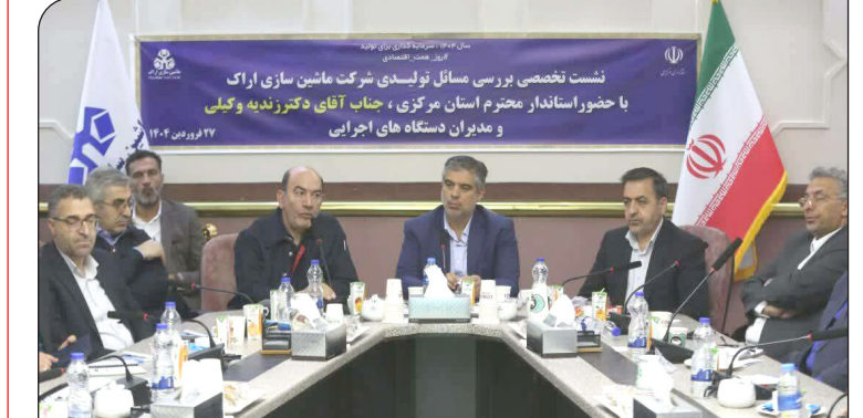
نشست تخصصی بررسی مسائل تولیدی شرکت ماشین‌سازی اراک با حضور استاندار محترم استان مرکزی، جناب آقای دکتر زنده و کیلی و مدیران دستگاه‌های اجرایی