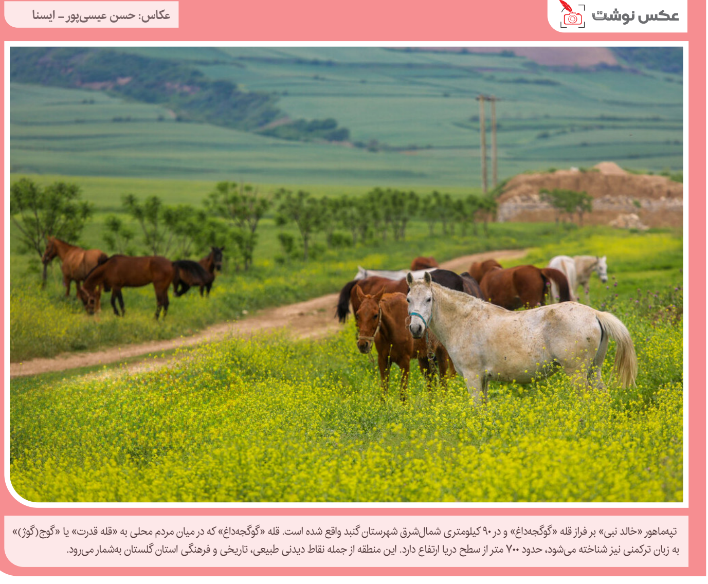
تیمه‌ماهور «خالد نبی» بر فراز قله «گوگج‌داغ» و در ۹۰ کیلومتری شمال شرق شهرستان گنبد واقع شده است. قله «گوگج‌داغ» که در میان مردم محلی به «قله قدرت» یا «گوچ (گوژ)» به زبان ترکمنی نیز شناخته می‌شود، حدود ۷۰۰ متر از سطح دریا ارتفاع دارد. این منطقه از جمله نقاط دیدنی طبیعی، تاریخی و فرهنگی استان گلستان به‌شمار می‌رود.