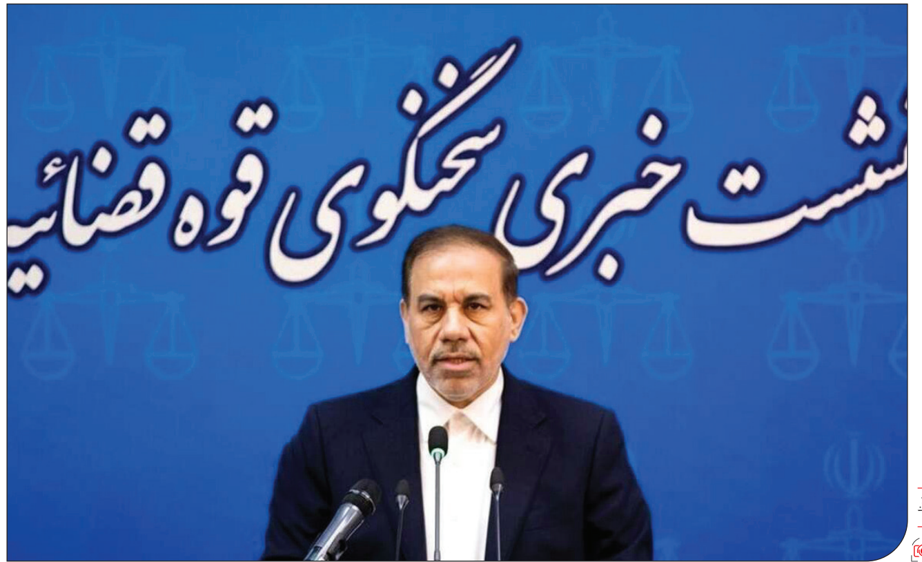
سخت‌گویی قوه قضائیه:

به‌گفته او، همچنین خلع يد و بازگشت ۱۸ هزار ۷۱۸ هکتار از اراضی ملی به بیت‌المال انجام شد.