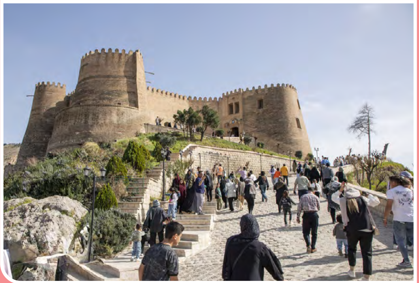
با آغاز تعطیلات نوروز ۱۴۰۳، مسافران و گردشگران بسیاری از اماکن تاریخی و گردشگری لرستان و شهر خرم‌آباد بازدید کردند. قلعه فلک‌الافلاک (دژ شاپور) قلعه‌ای تاریخی متعلق به دوره ساسانیان است که بر فراز تپه‌ای در مرکز شهر خرم‌آباد در استان لرستان قرار گرفته است.