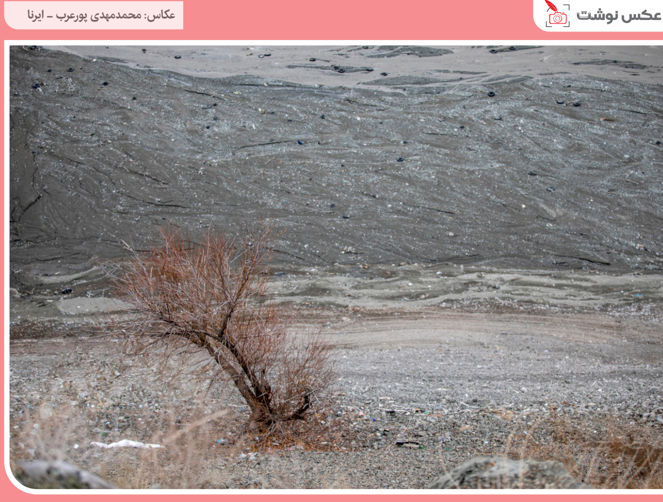
سد کرج، یکی از مهم‌ترین منابع تأمین آب شرب تهران، با بحرانی بی‌سابقه در میزان ذخایر آبی خود مواجه شده است. حجم آب این سد، که نقشی کلیدی در تأمین نیاز آبی نزدیک به پنج میلیون نفر در استان تهران ایفا می‌کند، اکنون به فقط ۸ درصد ظرفیت کامل رسیده است. این کاهش چشمگیر نشان‌دهنده افتی ۵۶ درصدی نسبت به سال گذشته است.