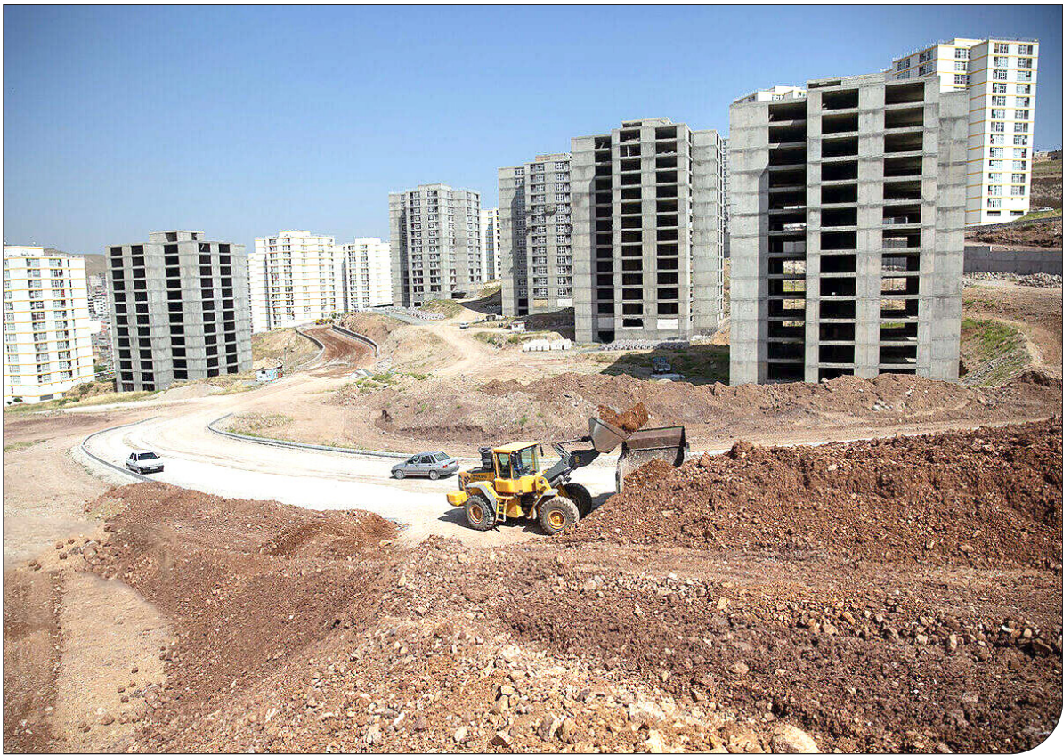
وزیر راه و راه‌سازی

وزیر راه‌وشهرسازی از پیشرفت‌های جزئی در تکمیل مسکن ملی خبر داد، اما هزینه‌ها همچنان نامشخص است