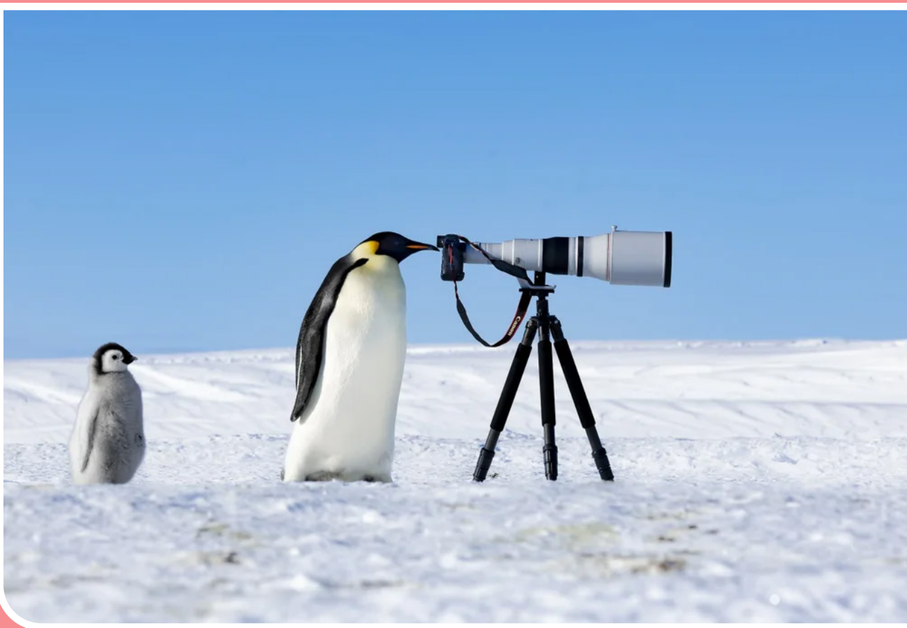
برندگان دومین مسابقه سالانه عکاسی طبیعت ۲۰۲۴ معرفی شدند. تصاویر آنها، لحظات نفس‌گیری را ارائه می‌دهند که زندگی در سیاره ما را به نمایش می‌گذارد. تصویر این پنگوئن یکی از تصاویر برنده این مسابقه است که «توماس ویجایان» آن را ثبت کرده است.