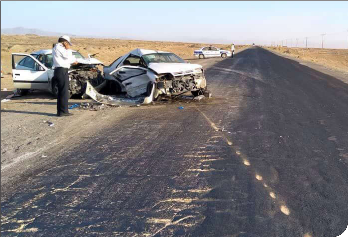
باشگاه خبرنگاران جوان

«شیش دونگ برانیم» پویش جدیدی است که برای کاهش تصادفات و تلفات جاده‌ای در نظر گرفته شده است تصادفات سالیانه ۲۰ هزار قربانی می‌گیرد، آیا «شیش دونگ برانیم» جواب می‌دهد؟