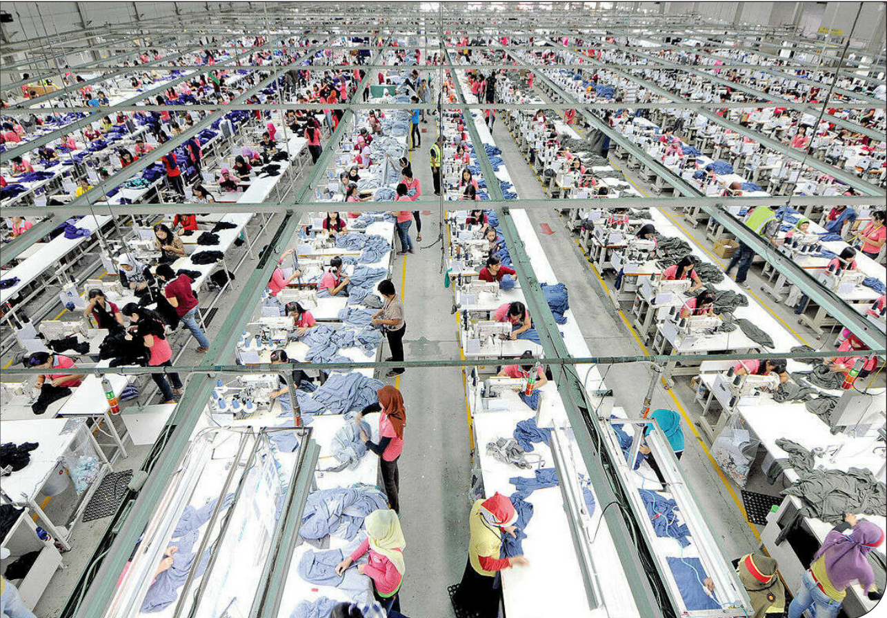
تأثیر صنعت لباس بر افزایش گازهای گلخانه‌ای، صنعت مد چگونه زمین را آلوده می‌کند؟