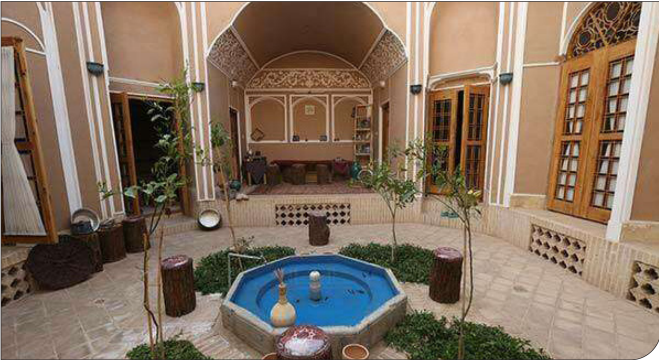
— ۱ —