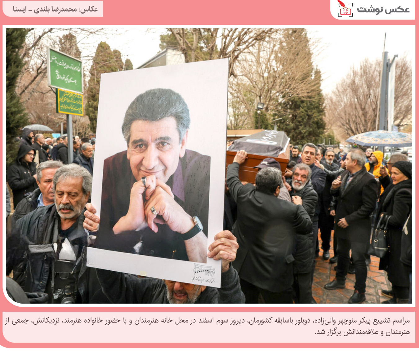
مراسم تشییع پیکر منوچهر والی‌زاده، دیپلور با سابقه کشورمان، دیروز سوم اسفند در محل خانه هنرمندان و با حضور خانواده هنرمند، نزدیکانش، جمعی از هنرمندان و علاقه‌مندان برگزار شد.