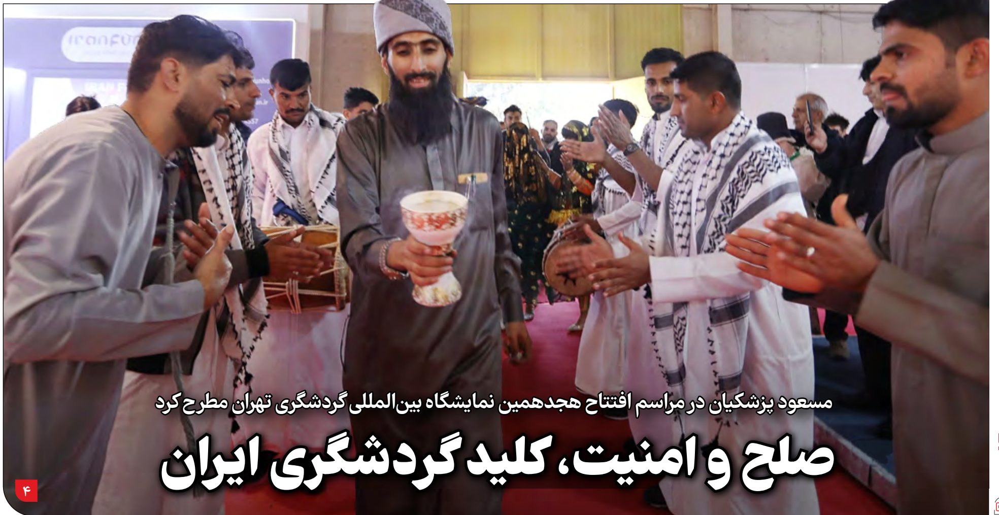
مسعود پزشکیان در مراسم افتتاح هجدهمین نمایشگاه بین المللی گردشگری تهران مطرح کرد

شرکت های توزیع گاز در هر سه استان شمالی همزمان با تداوم سرما از روند صعودی مصرف گاز خبر می دهند و از شهروندان طلب همراهی در کاهش مصرف دارند