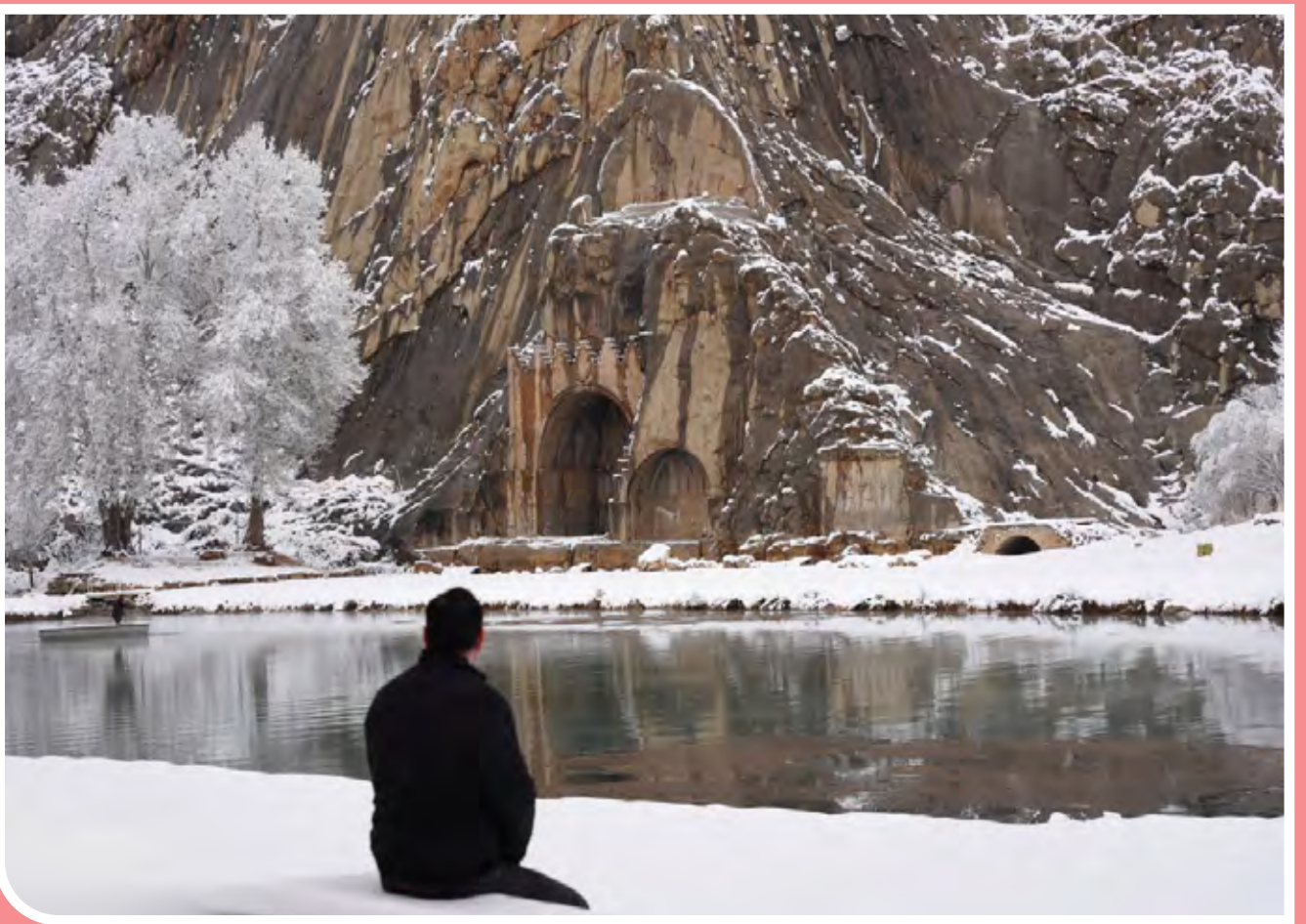
با نخستین بارش برف زمستانی در مجموعه تاریخی فرهنگی تاق‌بستان، یادگار خسرو پرویز پادشاه ساسانی ایران سفید پوش شد.