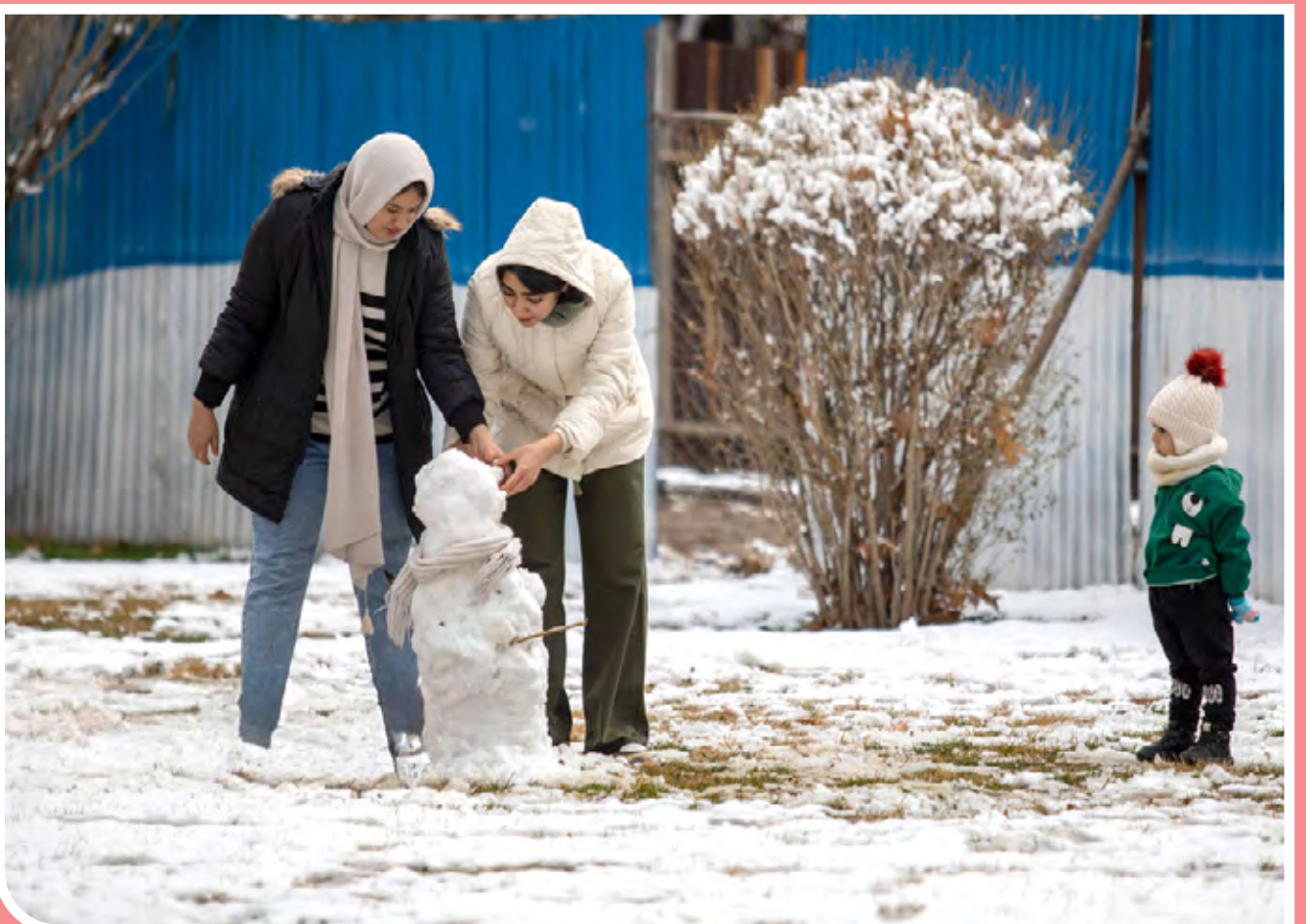
بعد از یک دوره نسبتاً طولانی که در تهران از باریدن برف و باران خبری نبود، بالاخره هوای تهران روز یکشنبه، ۲۱ بهمن، همچون چند شهر دیگر ایران کاملاً برفی و بارانی شد.