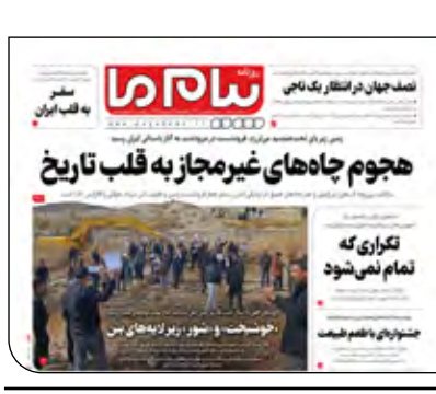
پیام ما دیروز