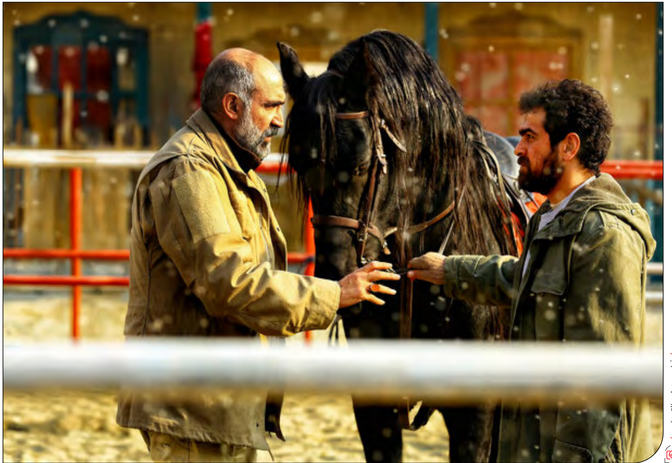
فیلم سینمایی ناتوردشت

محیطزیست در قاب سینما، جشنواره فیلم فجر چقدر به طبیعت اهمیت می‌دهد؟