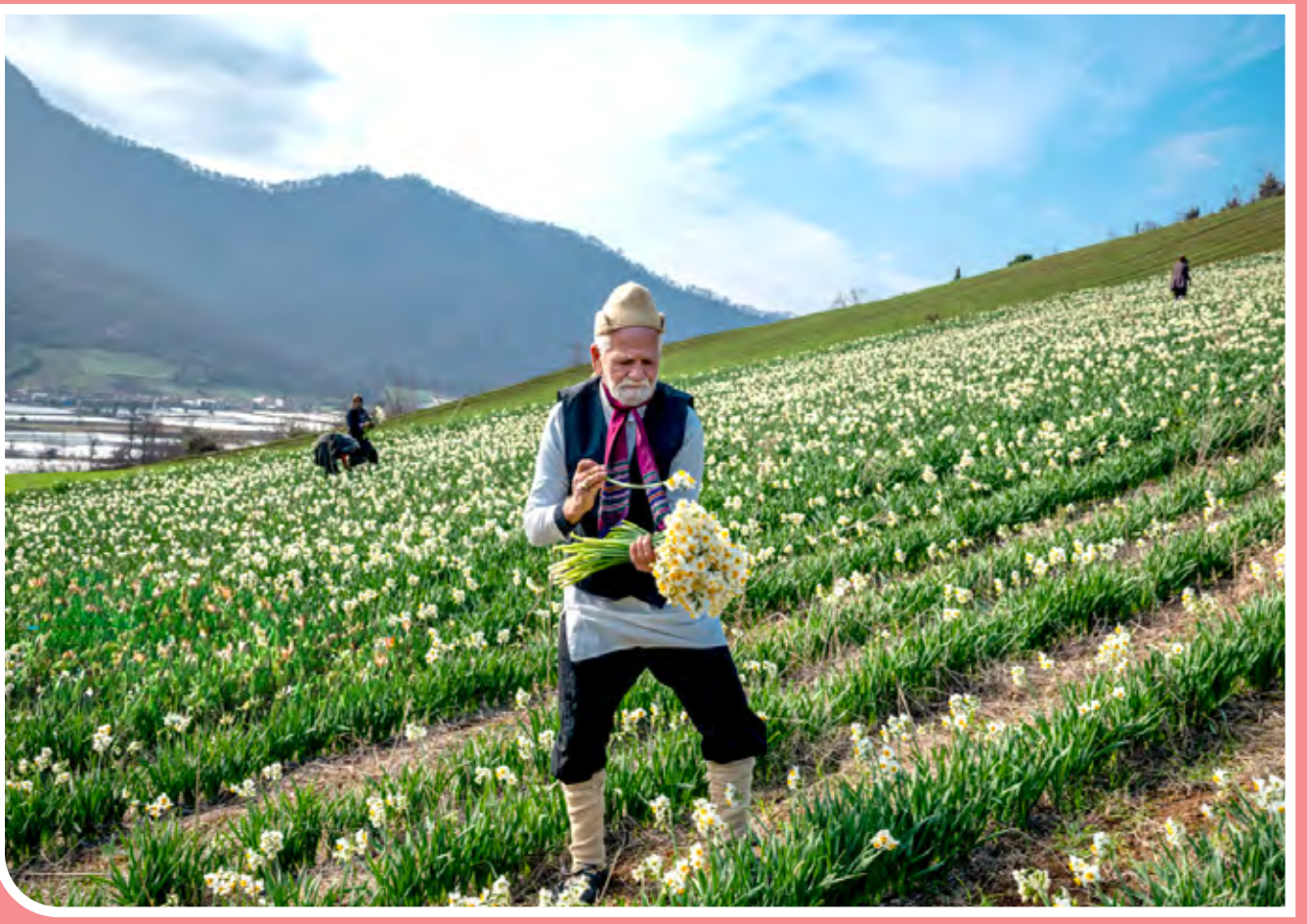
هر سال گل نرگس به‌صورت پیاز گل در مزارع استان گلستان از اواسط مردادماه تا اواخر شهریورماه کشت و از اوایل دی تا اواخر بهمن برداشت می‌شود.