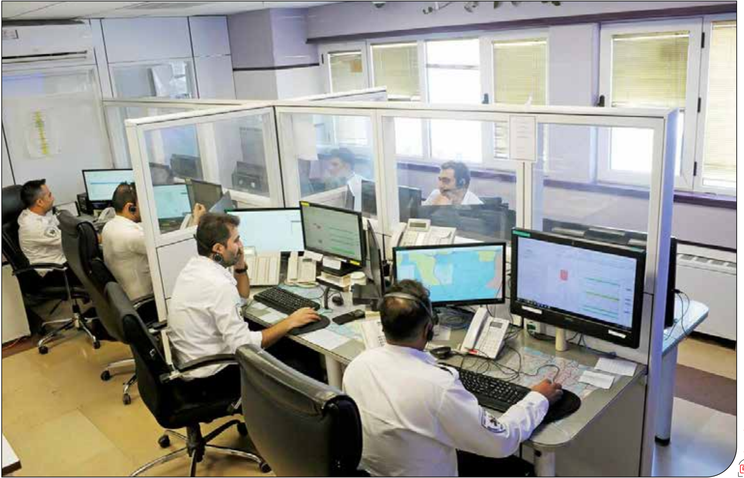
تحلیل «پیام ما» از آثار و تبعات رشد ۱۳۰۰ درصدی مزاحمت‌های تلفنی اورژانس به‌عنوان زنگ خطری جدی برای جامعه