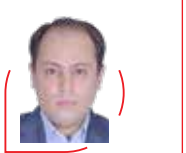
محسن تیزهوش | منتقد سینما

یک تهیه‌کننده موسیقی به اسم «لارا» بعد از اینکه چندبار در تست «من ربات نیستم» کچا شکست می‌خورد، دچار یک سرگیجه مفهومی پرداخته‌ایم.