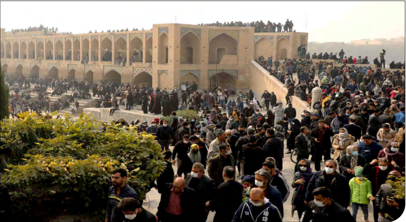
اعتراض در تهران