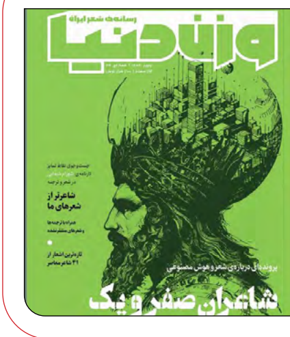
شاعران صفریوک و یک

انتشار شماره جدید مجله «وزن دنیا» شماره سی‌وچهارم مجله وزن دنیا با پرونده‌های درباره شعر و هوش مصنوعی و جست‌وجویی در نقاط تمایز کارنامه شهرام شیدایی در ترجمه و شعر منتشر شد. به‌گزارش ایستا، در این شماره، می‌توانیم از چهل‌ویک شاعر معاصر شعر بخوانیم. بخشی از مطالب این شماره درباره پرونده‌های با عنوان «شاعران صفریوک» است که به موضوع شعر و هوش مصنوعی پرداخته است. «احتمالی برای آینده شعر در دنیای تکنولوژی»، «هوش مصنوعی و دگردیسی زبان»، «عمیق و سریع» و... برخی دیگر از عنوان‌های شماره جدید وزن دنیا هستند.