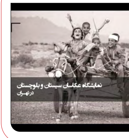
نمایشگاه عکاسان سیستان و بلوچستان در تهران

نمایشگاه عکاسان سیستان و بلوچستان در تهران نمایشگاه گروهی عکس هنرمندان سیستان و بلوچستان از عصر روز سه‌شنبه، ۱۸ دی‌ماه، در نگارخانه شفق تهران گشایش می‌یابد. به‌گزارش ایرنا، در متن قاب نخست نمایشگاه عکاسان سیستان و بلوچستان با عنوان ۴۰ عکس ۴۰ عکاس آمده است: دنیای پر تصویر امروز، دنیایی تأثیرگذار و تأثیرپذیر از عکس است و این مهم بر هیچ‌کس فراموش‌ناشدنی نیست! و کانون‌های عکاسی شهری و استانی، محلی و منطقه‌ای از جمله مراکز صاحب‌تأثیر در این امر هستند؛ کار مرکزی چون دفتر رسانه «پایگاه عکس چلیپک» رصد همین توانمندی‌ها است که این‌بار کانون عکاسان مستقل سیستان و بلوچستان را در زاهدان هدف گرفت.