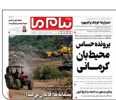
پیام ما دیروز