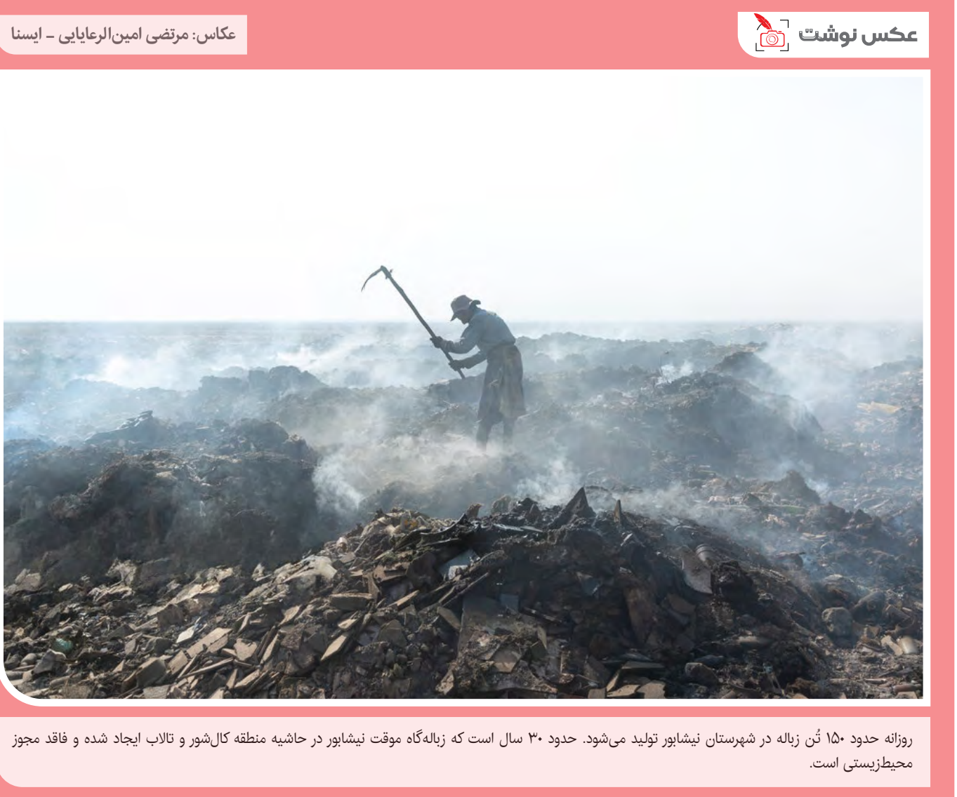
روزانه حدود ۱۵۰ تُن زباله در شهرستان نیشابور تولید می‌شود. حدود ۳۰ سال است که زباله‌گاه موقت نیشابور در حاشیه منطقه کال شور و تالاب ایجاد شده و فاقد مجوز محیط‌زیستی است.