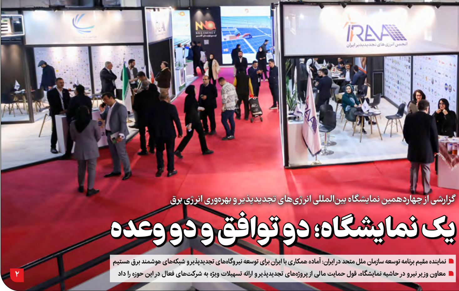
گزارشی از چهاردهمین نمایشگاه بین‌المللی انرژی‌های تجدیدپذیر و بهره‌وری انرژی برق

معاون فنی اداره کل محیط‌زیست استان گلستان: اگر اسناد مالکیت سازمان محیط‌زیست ابطال شود، بسیاری از اشخاصی که اراضی آنها خریداری شده است با رجوع به عکس‌های هوایی دهه ۴۰ می‌توانند هم سازمان محیط‌زیست و هم سازمان منابع طبیعی را محکوم کنند و اراضی دولتی را صاحب شوند