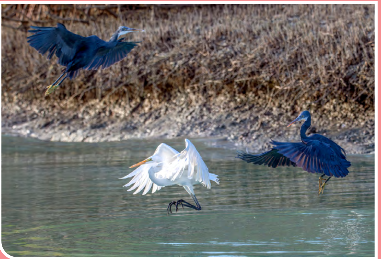
خور «تیاب» در ۳۰ کیلومتری شهر میناب و در حوزه گلاهی و سیریک (شرق بندرعباس) قرار دارد. این منطقه حفاظت‌شده، از نظر وسعت مشابه جنگل‌های حرای قشم است و جاذبه‌های گردشگری بسیاری دارد. «تیاب» به معنای «ته آب» و زیستگاه بسیاری از پرندگان مهاجر است.