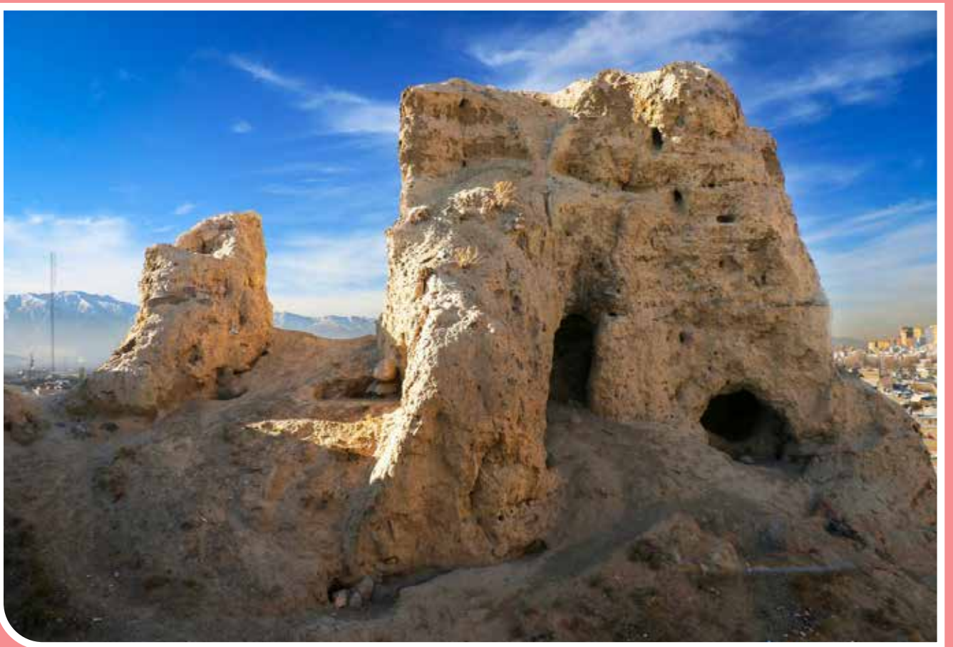
قلعه تاریخی ماندآگازنا یا تپه تاریخی یالدر در شهر مرند استان آذربایجان شرقی این روزها در سایه بی‌توجهی مسئولان و متولیان فاصله چندانی تا نابودی کامل ندارد. قدمت این قلعه به بیش از شش هزار سال می‌رسد و به‌عنوان یکی از جاذبه‌های تاریخی کشور و استان آذربایجان شناخته می‌شود.