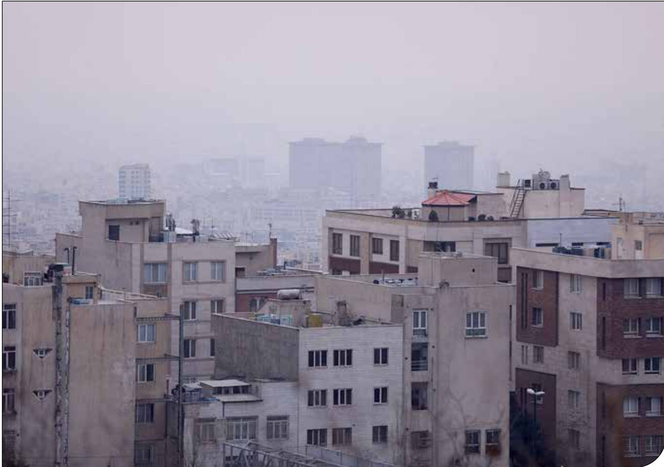
گزارش «پیام ما» از نشست ویژه بررسی وضعیت آلودگی هوای شهر تهران با حضور تشکل‌های تخصصی