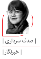
| صدف سرداری | | خبرنگار |

هرچند که دی‌ماه همان سال «عیسی زارع‌پور»، وزیر ارتباطات دولت سیزدهم، این موضوع را تکذیب کرد: «چیزی به اسم اینترنت طبقاتی نداریم، برای ما همه مردم خاص هستند. براساس مصوبه‌ای که از سال‌ها پیش بوده، برای برخی متخصصان مثل فریلنسرها و آزادکارها دسترسی وسیع‌تر دارند، اما چیزی به اسم اینترنت طبقاتی نداریم». اما این اولین باری نبود که از اینترنت طبقاتی صحبت می‌شد. آن‌طور که مجله «پیوست» نوشته پیش‌ازین نیز اینترنت طبقاتی به اشکال دیگری در مقاطعی اجرا شده است. در دهه ۸۰ کاربران خانگی تنها مجاز بودند تا سقف سرعت ۱۲۸ کیلوبیت بر ثانیه سرویس دریافت کنند که این محدودیت با روی کار آمدن دولت یازدهم برداشته شد. اما آیا در طرح جدید شورای عالی فضای مجازی و با تغییر عنوان از «طبقات» به «اقشار» آیا قرار است برنامه متفاوتی درباره آن اجرا شود؟