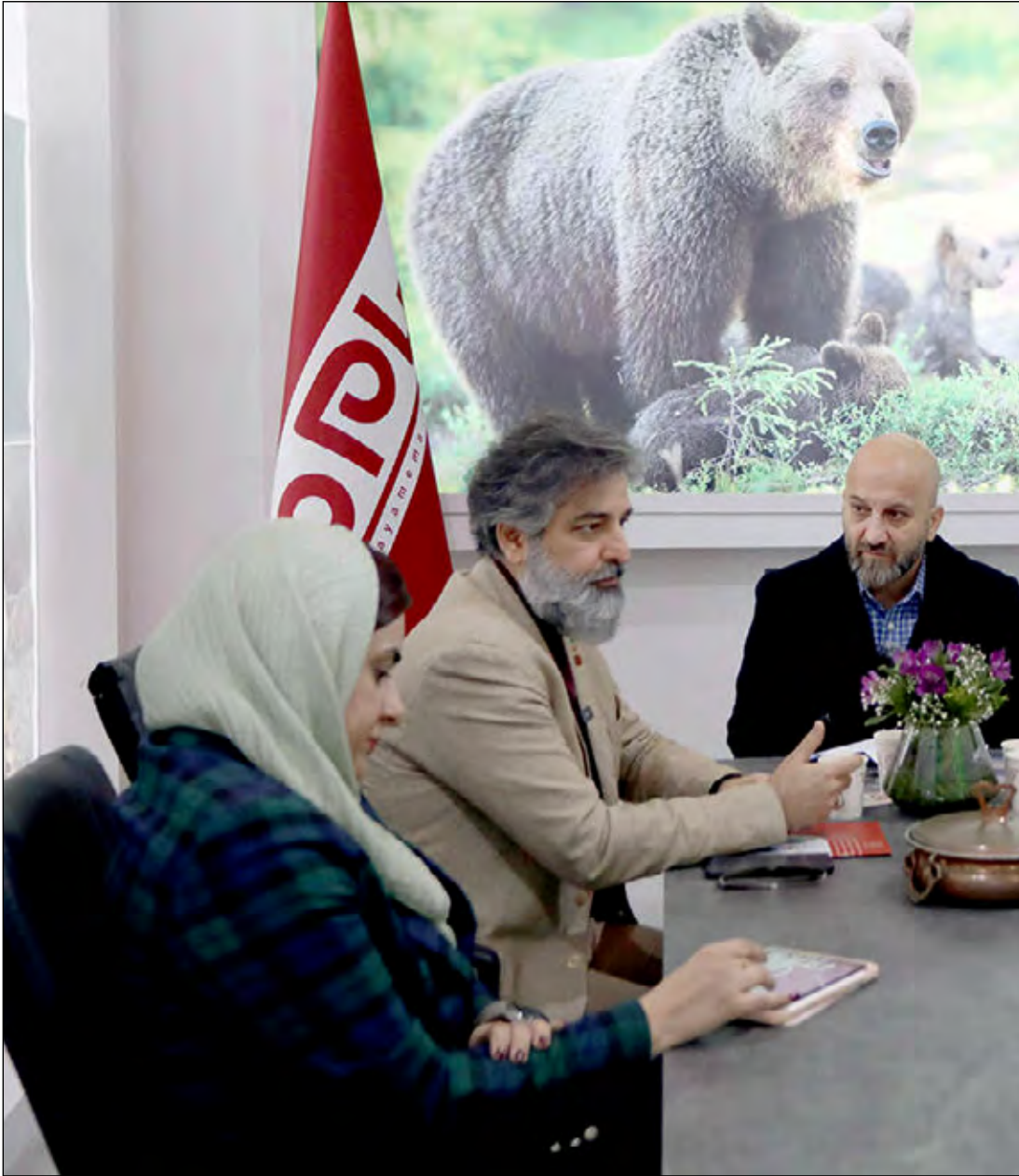
- مدیرعامل شرکت توسعه خدمات حمل و نقل مسافر -