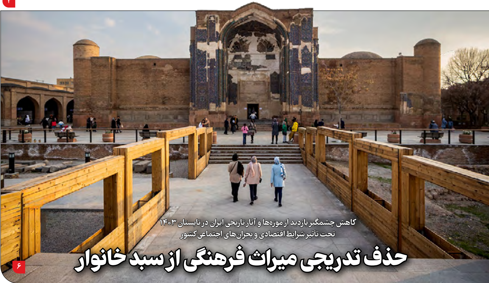
کاهش چشمگیر بازدید از موزه‌ها و آثار تاریخی ایران در تابستان ۱۴۰۳ تحت تأثیر شرایط اقتصادی و بحران‌های اجتماعی کشور

سدهای مرزی افغانستان، هریرود را از جریان طبیعی محروم کرده‌اند؛ کاهش شدید آورد آب این رودخانه به سد دوستی، تأمین آب شرب خراسان رضوی را با بحران مواجه می‌کند