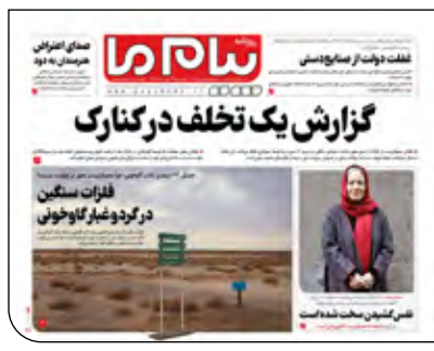
پیام ما دیروز