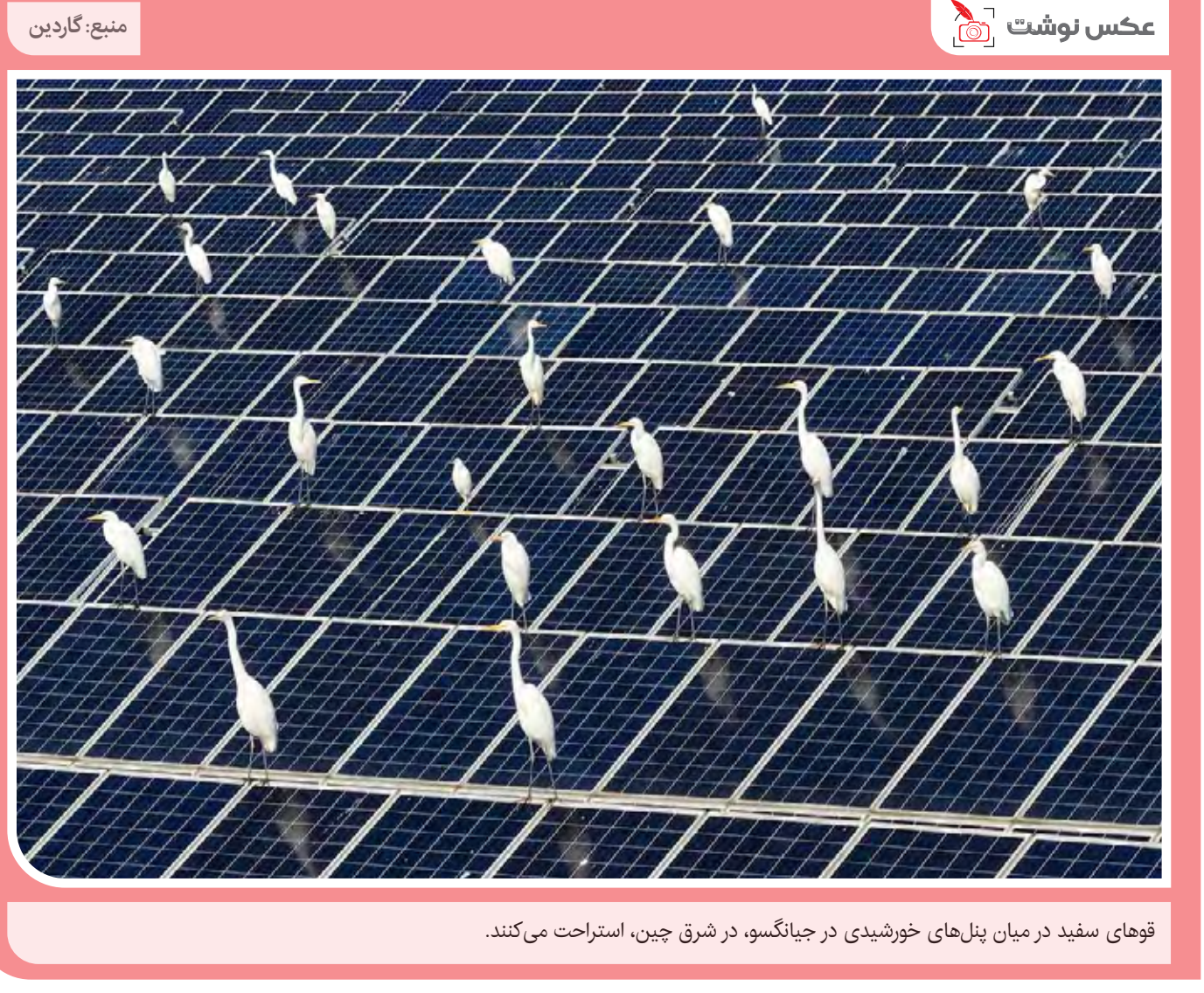
قوهای سفید در میان پنل‌های خورشیدی در جیانگسو، در شرق چین، استراحت می‌کنند.